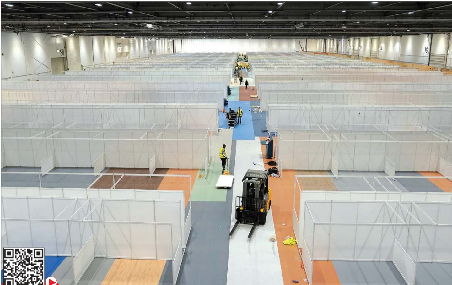
متقاعدون وجنود يبنون مستشفى ميدانيا لاستقبال المصابين بفيروس كورونا في لندن أمس

بانكوك - رويترز: قال مسؤول بارز بوزارة العدل التايلندية لـ «رويترز» إن سجناء أضرموا النار في مقصف سجن في شمال شرق البلاد وفر عدد من السجناء وسط أعمال شغب أمس أثارتها شائعات عن تفشي فيروس كورونا المسجد. وأظهرت تقارير إخبارية أعمدة دخان ضخمة تتصاعد فوق السجن الذي يضم نحو ألفي نزيل من الرجال والنساء في إقليم بوريرام. وقال المسؤول الذي طلب عدم نشر اسمه لأنه غير مصرح له بالحديث للإعلام «مجموعة صغيرة من السجناء حكم عليها بالسجن مدى الحياة في وقت سابق هذا الأسبوع ففشرت شائعة عن أن المنشأة غير آمنة بسبب كوفيد-19». وأضاف: «انضم للمجموعة مائة سجين آخر في أعمال الشغب». وقال كريسانا باتانتشارون نائب المتحدث باسم الشرطة لـ «رويترز» إن ضباط الشرطة انتشروا لاحتواء المسوقف بما في ذلك ملاحقة الهاربين أثناء الفوضى. وفرضت قيود على الحركة في عدة أقاليم في تايلند مع ارتفاع عدد حالات الإصابة بالفيروس إلى 1388 حالة بزيادة 143 حالة جديدة أعلنت أمس. وأعلنت تايلند كذلك حالة وفاة واحدة جديدة ليبلغ إجمالي عدد الوفيات بسبب الفيروس سبع حالات.