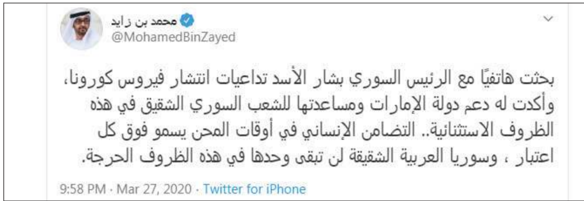
صورة عن تغريدة ولي عهد ابوظبي صاحب السمو الشيخ محمد بن زايد آل نهيان

وفي السياق ذاته، قررت وزارة التربية تدمير تعطيل المدارس العامة والخاصة والمعاهد التابعة لها والجامعات الحكومية والخاصة والمعاهد العليا اعتباراً من 2 إلى 16 أبريل المقبل.