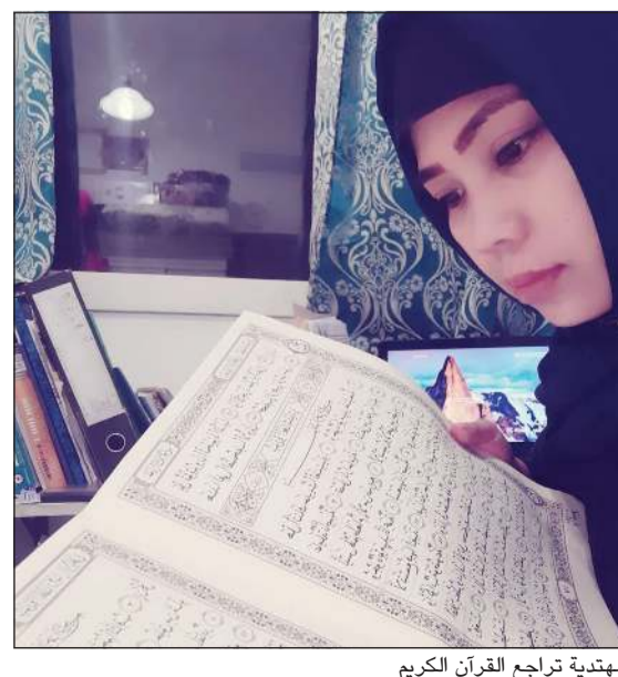
مهتدي تراجع القرآن الكريم

عبر هذا البرنامج 158 دورة استفاد منها قرابة 1600 دارسة من مختلف الجنسيات واللغات، وتنوعت بين الدورات الشرعية المختلفة كالعقيدة والمهتديات وكل من يعيش على أرض الكويت بعدم الخروج من المنازل إلا للضرورة القصوى، وترجمة المؤتمر الصحافي اليومي لوزارة الصحة ونشره بعدة لغات، وكذلك توزيع قصص خاصة بالأطفال لتوعيتهم من مخاطر الفيروس، بجانب تخصيص أكثر من 15 خط هاتف للإجابة عن أسئلة واستفسارات الجاليات على مدار الـ 24 ساعة، أملياً نشر الطمانينة والإيجابية في نفوسهم. وختاماً، توجهت السعيد بال دعاء إلى الحق سبحانه أن يحفظ البلاد والعباد وأن يكشف الغمة عن العالمين، أنه سبحانه ولي ذلك والقادر عليه.