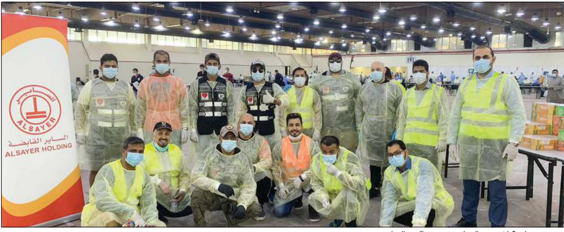
صورة جماعية لفريق «الساير دوم وياكم» التطوعي

بالشراكة مع فريق «نهتم» التطوعي وفريق الإسناد والإنقاذ الكويتي و«أمريكانا»