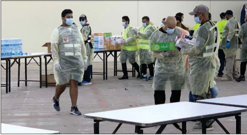
جانب من توزيع الوجبات