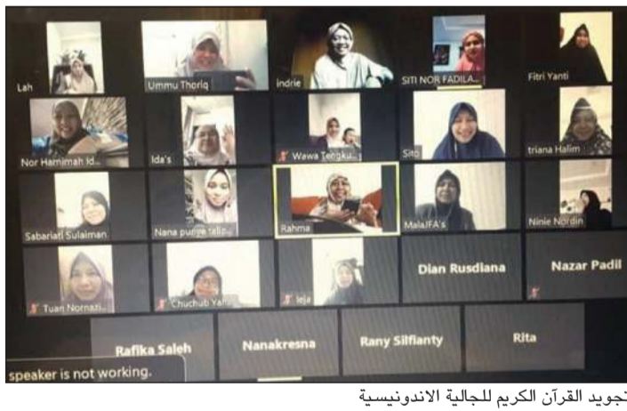
تجويد القرآن الكريم للجالية الاندونيسية

عبر هذا البرنامج 158 دورة استفاد منها قرابة 1600 دارسة من مختلف الجنسيات واللغات، وتنوعت بين الدورات الشرعية المختلفة كالعقيدة والمهتديات وكل من يعيش على أرض الكويت بعدم الخروج من المنازل إلا للضرورة القصوى، وترجمة المؤتمر الصحافي اليومي لوزارة الصحة ونشره بعدة لغات، وكذلك توزيع قصص خاصة بالأطفال لتوعيتهم من مخاطر الفيروس، بجانب تخصيص أكثر من 15 خط هاتف للإجابة عن أسئلة واستفسارات الجاليات على مدار الـ 24 ساعة، أملياً نشر الطمانينة والإيجابية في نفوسهم. وختاماً، توجهت السعيد بال دعاء إلى الحق سبحانه أن يحفظ البلاد والعباد وأن يكشف الغمة عن العالمين، أنه سبحانه ولي ذلك والقادر عليه.