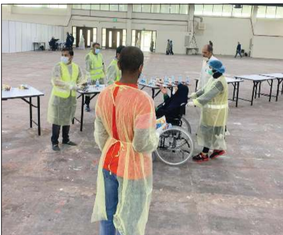
مساعدة كبار السن

كبير من وجبات الكروسان لتوزيعها على الحضور أثناء الحملة، كما أننا نوصي جميع أفراد المجتمع بالحرص على الالتزام بالتعليمات الصادرة من قبل الجهات الحكومية والبقاء في منازلهم، وعدم الاختلاط مع الغرباء قدر المستطاع، والحفاظ على تعقيم وغسل اليدين باستمرار، ونسأل العلي القدير أن تصبح هذه الأيام مجرد ذكرى عابرة، وأن يعود الأمن والصحة والعافية على بلدنا الحبيب الكويت.