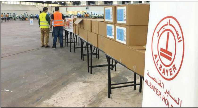
فريق «الساير دوم وياكم» .. ومشاركة مميزة بمبادرة «الكويت بخير»