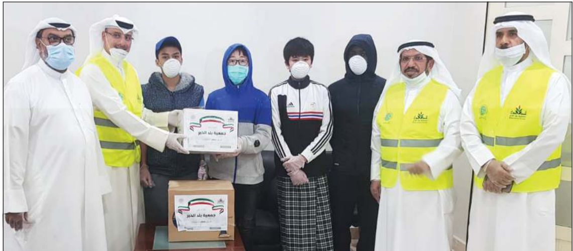
جانب من توزيع المعقمات على طلبة البعثات الدراسية في المعهد الديني