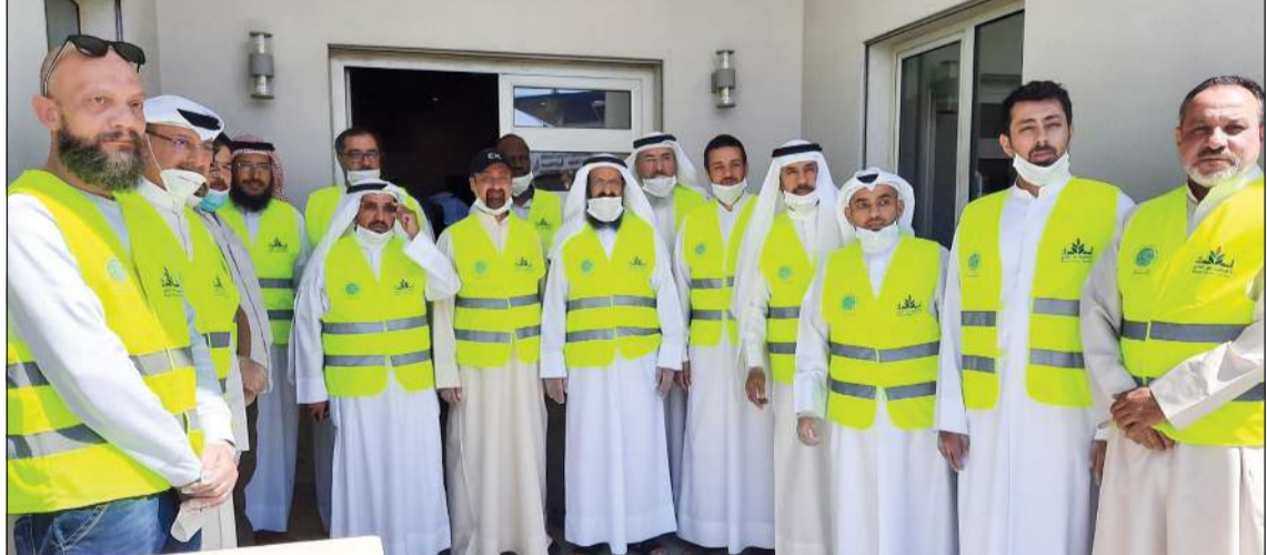
لقطة تذكارية مع فريق الجمعية

السمو الأمير الشيخ صباح الأحمد، حفظه الله ورعاه، والتي جاءت في خطابه السامي بشأن دعوة الجميع للمسارعة إلى الفرزة للكويت الذي اتخذ كشعار لحملة وطنية للجمعيات الخيرية، وذلك بهدف مواجهة أزمة فيروس كورونا المستجد والوقوف إلى جانب الجهات المعنية. وأضاف الراجحي: ومن منطلق مواجهة تداعيات