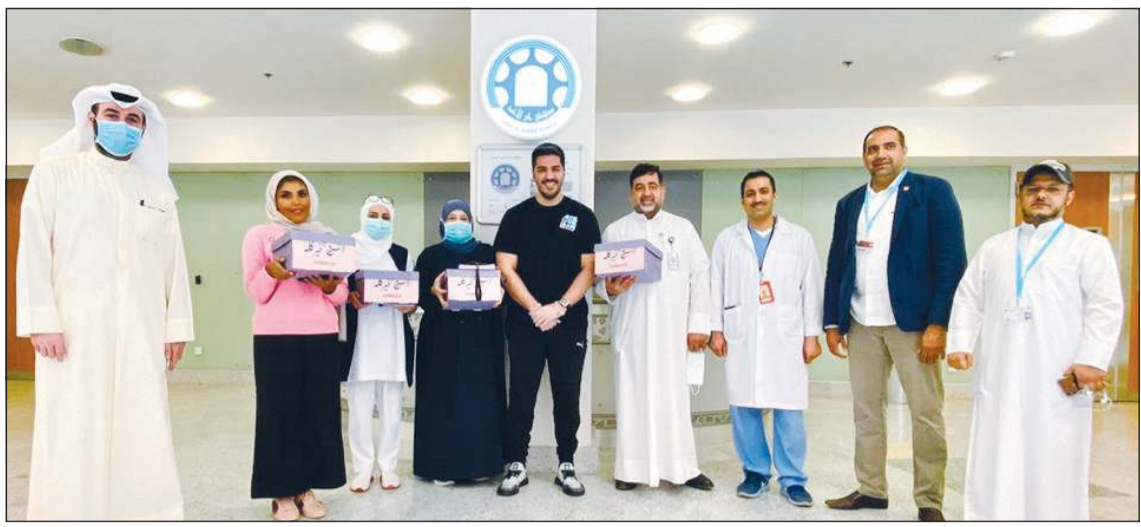
لقطة جماعية خلال مشاركة الأمهات في عيدهن

وتتضمن فورد تجميع أكثر من 100 ألف قناع بلاستيكي لحماية الوجه أسبوعياً، وتسخير إمكاناتها في تقنية الطباعة ثلاثية الأبعاد لإنتاج مكونات تستخدم في لوقاية الشخصية من الفيروس.