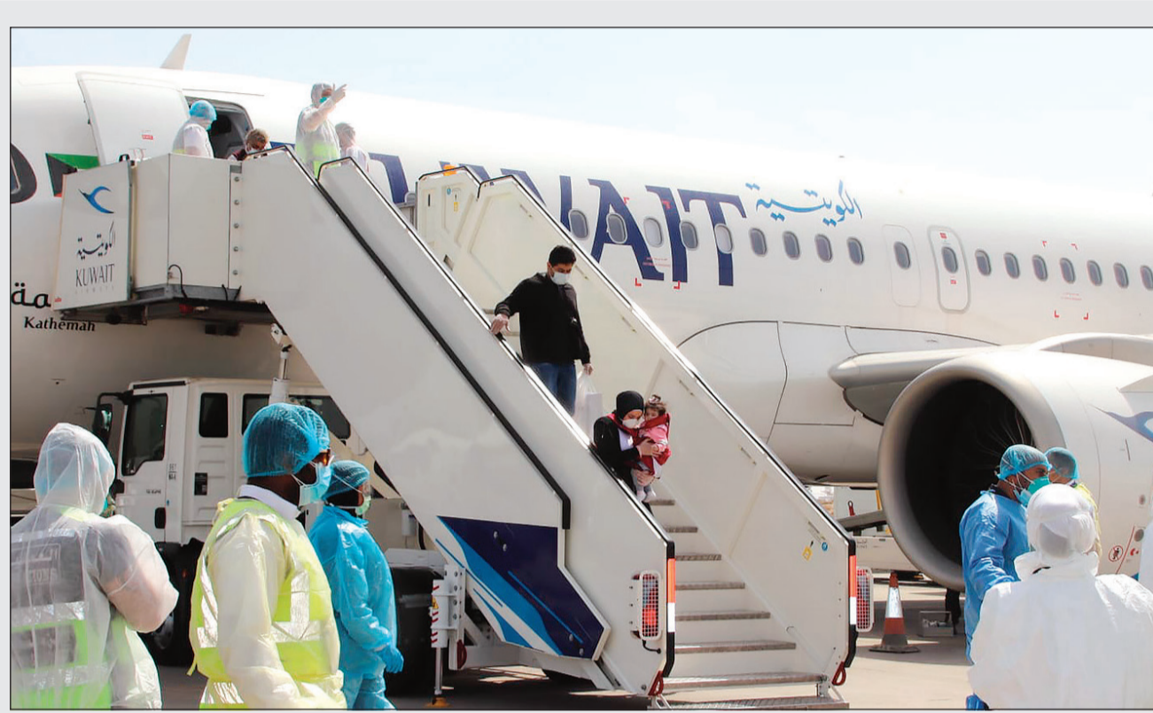
مواطنون لدى عودتهم من بيروت على متن «الكويتية» أمس ضمن خطة الإجراء

وشددت المصادر على أنه بات من الأهمية طرح الكمادات الموجودة لدى وزارة التجارة والبالغ عددها 8 ملايين و600 ألف كمام والتي تنتظر رفع وزارة الصحة ملاحظات إلى مجلس الوزراء. وعلى صعيد رواتب العاملين في القطاع الخاص، أكدت مصادر مطلعة أن أصحاب العمل الخاص ملتزمون بمسؤولياتهم في تحويل رواتب المواطنين العاملين لديهم إلى البنوك وفقا للنظم المعمول بها. واستدركت المصادر قائلة: إن أي فقرة في هذا الأمر سيتم علاجها ولن نترك أحدا منهم بدون راتب.