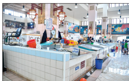
السوق شبه خال من الاسماك والزبائن (قاسم باشا)

■ فزعة «نفضية».. محجران في «الزور» والرتقة بسعة 2550 سبريرا