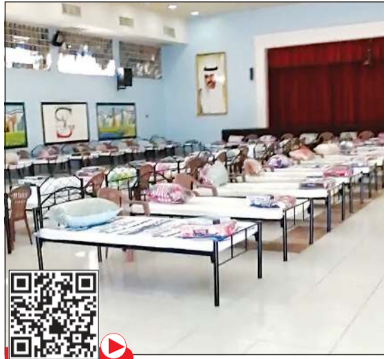
مقرات لاحتجاز المخالفين لقرار الحظر