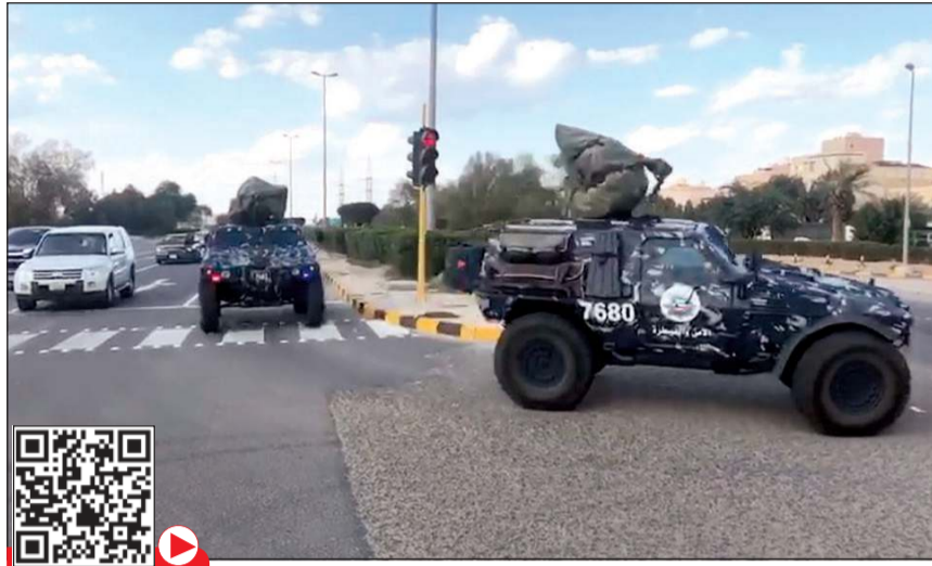
آليات من القوات الخاصة في طريقها للانتشار في شوارع الكويت قبل الحظر