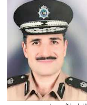
اللواء طلال معرفي

الإقامة لحملة المادة 18 للعاملين بالقطاع الأهلي عن طريق موقع وزارة الداخلية الإلكتروني (www.moi.gov.kw) بدلاً من مراجعة الإدارة العامة لشؤون الإقامة وذلك اعتباراً من أمس الاثنين الموافق 23/3/2020.