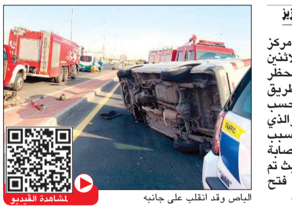
الباص وقد انقلب على جانبه