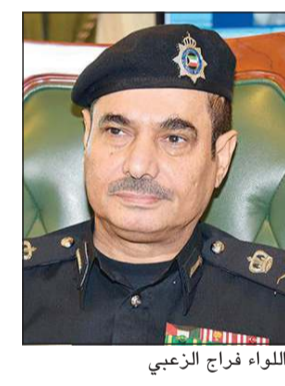
اللواء فراج الزعبي