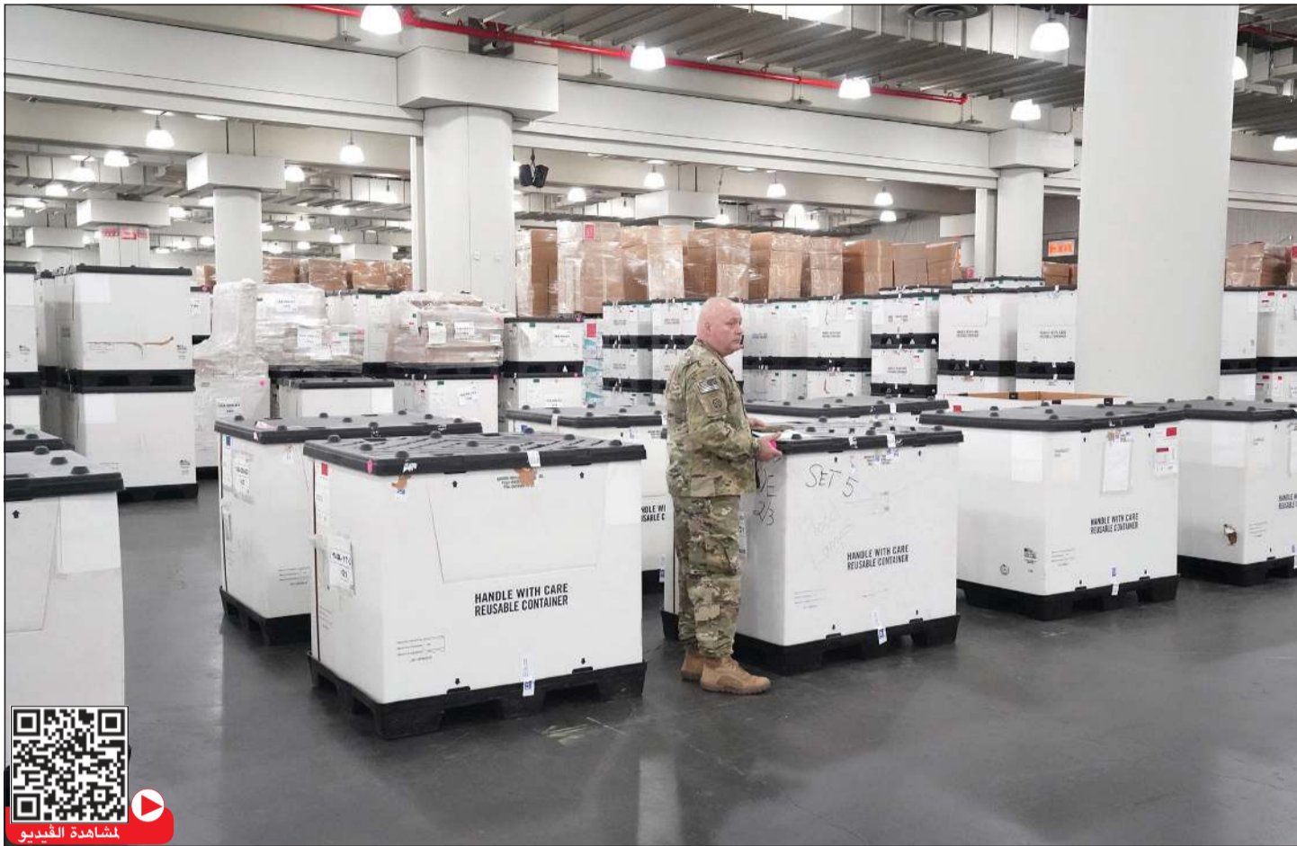
معدات طبية في مركز جاكوب جافيتس للمؤتمرات في مانهاتن بعدما قرر رئيس بلدية نيويورك أندرو كومو تحويله إلى مستشفى ميداني لمواجهة انتشار فيروس كورونا

وأضاف أن الدول ستضطر للتعامل مع التداعيات الاقتصادية «لسنوات».