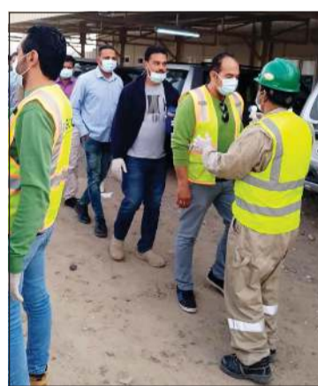
قياس حرارة العاملين قبل بدء العمل

العربية السعودية. إضافة جديدة وماذا يشكل هذا المشروع؟ سيكون المشروع إضافة جديدة إلى المشاريع الأخرى التي تنفذها الهيئة العامة للطرق، كما ان هناك حرصاً على توافر الاشتراطات والمعايير التعاقدية.