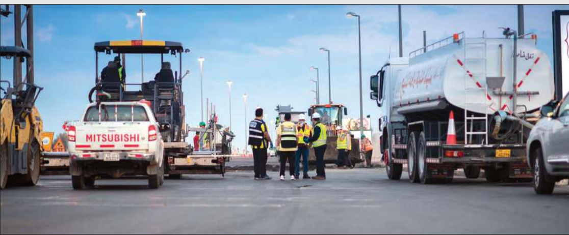
جانب من أعمال إصلاح الطريق