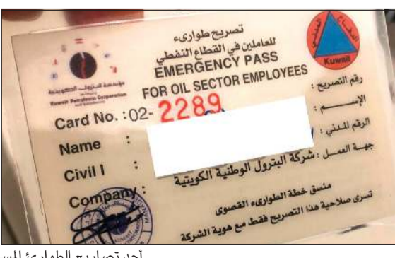
أحد تصاريح الطوارئ للسلمة للعاملين في القطاع النفطي