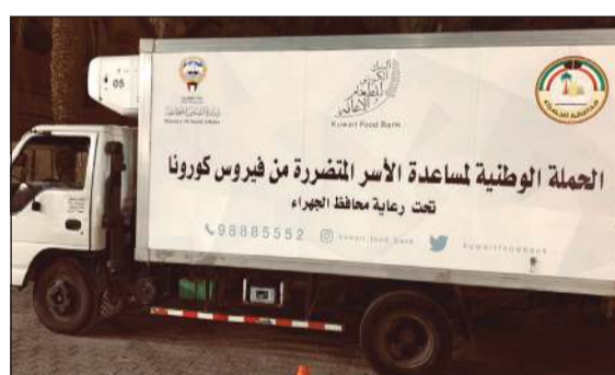
جانب من حملة «وياكم» التي أطلقها البنك الكويتي للطعام والإغاثة

والمتضررين من الفيروس، فضلاً عن متابعة حالات الأسر التابعة للبنك مع تطبيق إجراءات الوقاية وإرشادات وزارة الصحّة مؤكداً مواصلة البنك وقوفه إلى جانب الدولة في مواجهة أزمة الفيروس. في مواجهة، فمن محافظ الجهراء ناصر الحرف في تصريح مماثل لـ «كونا» الدور الذي يقوم به البنك الكويتي للطعام تجاه متضرري هذا الوباء، مشيداً بالجهود الكبيرة والمتواصلة التي تبذلها كل وزارات وقطاعات الدولة ومختلف مؤسساتها لحماية أهل الكويت والمقيمين على أرضها من فيروس كورونا وتوفير الرعاية الكاملة