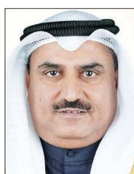
د. سعود الحربي

ذويهم. وقال الوزير الحربي لـ «كونا» الأحد أن هذا الإجراء يأتي تقديراً لظروف المعلمين الوافدين النفسية والاجتماعية ويشمل جميع الجنسيات بلا استثناء الراغبين في المغادرة. وأوضح أنه بعد تجهيز الخرجيات والانتهاء منها سيتم تحديد آلية للتسليم وفق إجراءات معينة ستحددها الوزارة