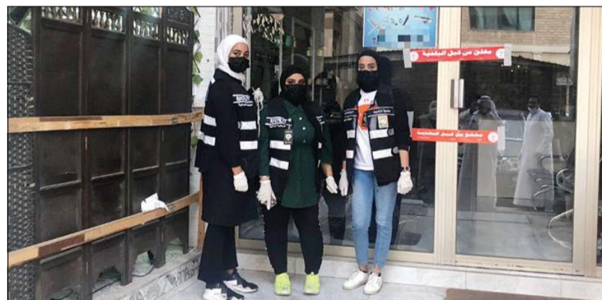
فريق البلدية خلال الحملة

قام فريق الطوارئ في بلدية محافظة حولي بالتعاون مع إدارة النظافة وإدارة التدقيق والمتابعة الهندسية واللجنة المشتركة بضبط صالون نسائي يزاول نشاطه بحرية وإغلاق صالون رجالي ومطعم وتم تحرير محاضر ضبط وإغلاق من جانب آخر، قام فريق طوارئ بلدية الأحمدى بحملة مكثفة حول نطاق المحافظة بالتعاون مع اللجنة الثلاثية، وقد أسفرت الحملة عن إغلاق صالون رجالي ومعهد صحي وتحرير 4 مخالفات.