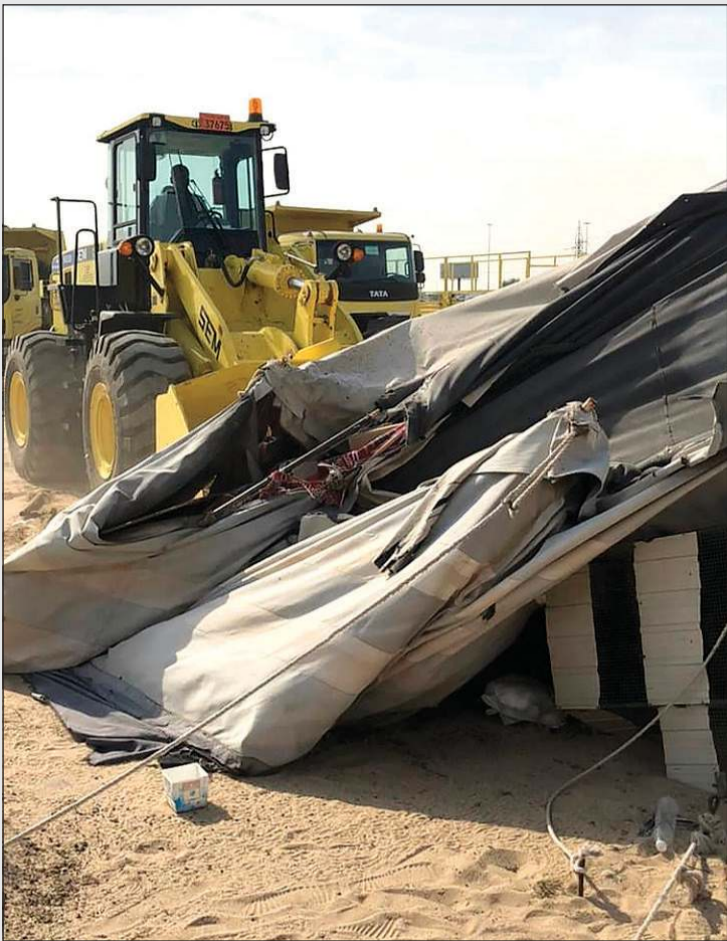
جانب من إزالة المخيمات المخالفة