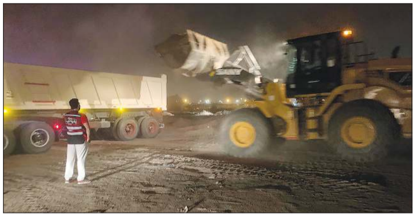
جانب من حملة النظافة في الفروانية

العام ورفع مستوى النظافة العامة بالمحافظة. وأضافت أنه تم تحديد 7 مواقع للتنظيف تضمنت الساحة الواقعة بجانب دوار المواصلات بمنطقة جلب الشيوخ، الساحة الواقعة بين جامعة الشدايدية والدائري السادس المقابلة لمنطقة صباح الناصر ومستشفى الفروانية، الساحة الواقعة خلف جمعية جلب الشيوخ، الساحة الواقعة خلف حديقة جلب الشيوخ وسجن طلحة، الساحة الواقعة جنوب منطقة خيطان مقابل فندق كراون بلازا، الساحة الواقعة بمنطقة الفروانية «الكبرف» مقابل الغزالي والضجيج، فضلاً عن رفع الأنقاض والمخلفات بالساحة الواقعة بمنطقة العارضية الصناعية مقابل العارضية السكنية.