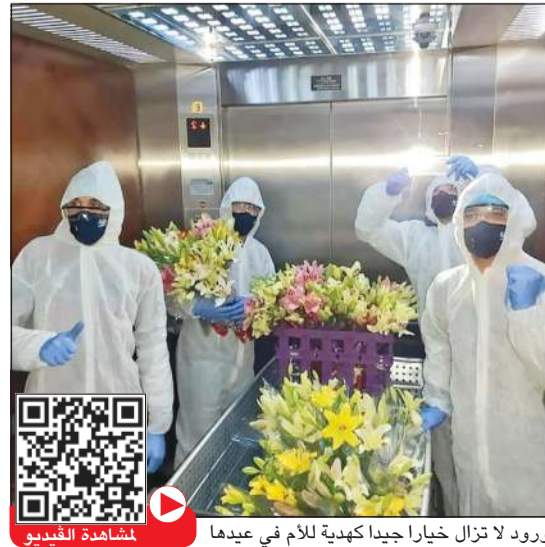
الورود لا تزال خيارا جيدا كهدية للأم في عيدها

مع «كورونا» اختلف كل ضمن ما اختلف في حياتنا بسبب هذا الفيروس الخطير يأتي عيد الأم هذه السنة في هذه الأوضاع العصيبة التي يمر بها العالم بمراته وعمق الحب الذي ولدته تلك الحرارة، فالكل قابع في منزله محجورا، يخشى الخروج من بيته، ممتنع عن الخروج والمصافحة والإقتراب، حتى أن بعض من يعيشون بعيدا عن أمهاتهم يخشون أن ينتقلوا إليهن لتنهتنهن وتقبل أديبهن مخافة نقل العدوى لهن. وفي هذه الظروف القاسية والتباعد الاجتماعي تبقى الأم نبع الحب، والأمهات في هذه الأيام يعيشن الخوف والقلق على مصير أبنائهن، سواء كن ربات منازل أو موظفات أو عاملات، فاعينهن شاردة دائما إلى صحة أطفالهن وعلى مستقبلهم الدراسي المعلق وعلى حالة الأبناء الخطير في الأوضاع الاقتصادية. فالأم وإن اختلف وضعها بين ربة المنزل والمرضاة والطبيبة والمدرسة وغيرها من المهن المتعددة، فإن نقطة واحدة تجمع بين الأمهات جميعا وهي التضحية، فالأم تضحي بوقتها وصحتها لأجل راحة أبنائها. على الجانب الآخر من سلبات «كورونا» يأتي الاضطراب إلى البقاء في المنازل ليكون له أثر إيجابي