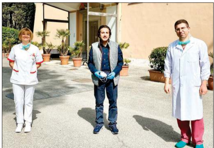
السفير الشيخ عزام الصباح خلال لقائه الطاقم الطبي لأحد المستشفيات

في ضوء الواقع الكارثي والمأساوي لانتشار فيروس كورونا المستجد في إيطاليا والتي وصلت حالات الإصابة فيها إلى نحو 47,440 حالة والوفيات إلى 4,032 حالة وفاة التقى سفيرنا لدى الجمهورية الإيطالية الشيخ عزام الصباح ببعض أفراد الطاقم الطبي لأحد المستشفيات الخاصة ذات الكفاءة الطبية للوقوف على جاهزيتها للتعامل مع أي حالة طارئة لا تسمح الله للكويتيين على الأراضي الإيطالية. وقال السفير الشيخ عزام الصباح إن البشرية والعلم سينتصران على الفيروس عن قريب، مجدداً دعوته للمواطنين الكويتيين في كل إيطاليا إلى اتخاذ جميع الاحتياطات والالتزام بكل الإجراءات الوقائية التي دعت إليها الحكومة الإيطالية خصوصاً وأن حالات الإصابة تتصاعد بشكل سريع.