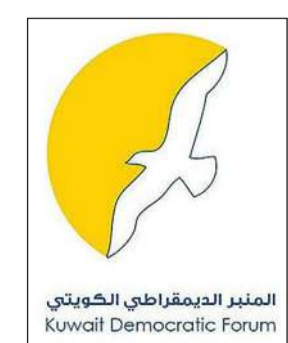
المنبر الديمقراطي الكويتي Kuwait Democratic Forum

شبهه الكامل بالتعليمات والتوجيهات التوعوية وملازمة منازلهم ما أمكن، كما أكد على أهمية تجسيد القدرة المتفائلة لمواجهة الوباء وبمعنويات عالية مع ضرورة الابتعاد عن بعض الخطيات والإشاعات المغرضة التي تحاول أن تخلق جهل أجواء شحن سلبية وخطرة على سلامة الوطن ومحاوله المساس بوحده المميزه والتي تقبخت الأزمات