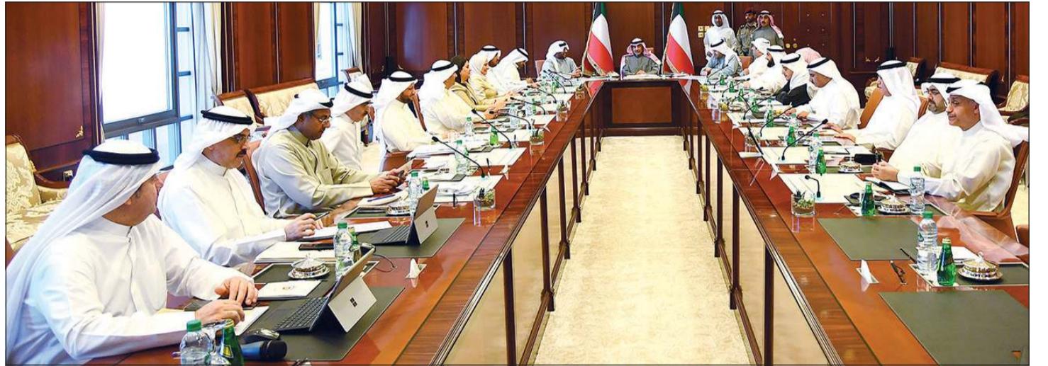
سمو رئيس مجلس الوزراء الشيخ صباح خالد متركسا الاجتماع