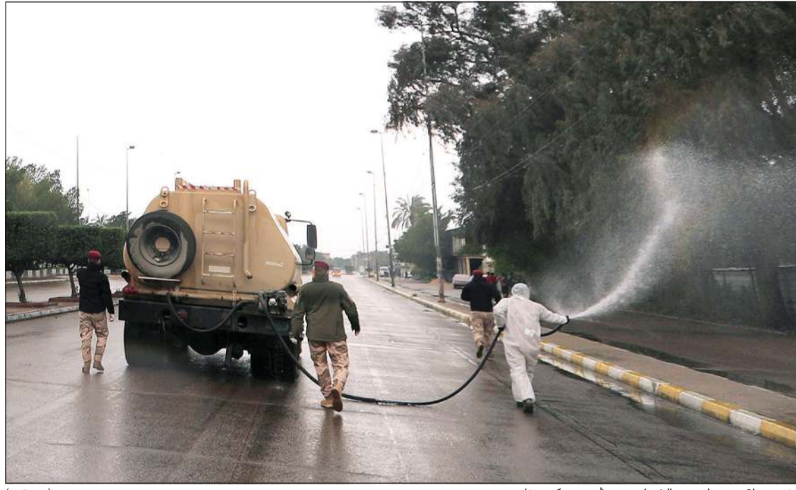
جنود عراقيون يطهرون الشوارع من فيروس كورونا (رويترز)

عواصم - وكالات: توعد الرئيس الإيراني حسن روحاني بالرد مجدداً على اغتيال واشنطن لقائد فيلق القدس التابع للحرس الثوري الإيراني قاسم سليماني في 3 يناير الماضي بطائرة مسيرة في العراق.