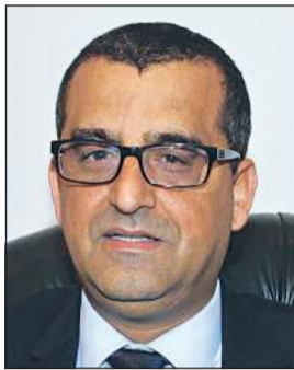
السفير التونسي أحمد بن الصغير