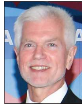
السفير البريطاني مايكل دافنبورت