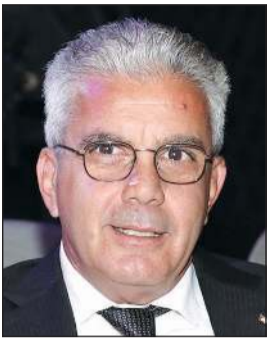
السفير الفلسطيني رامي طهوب

ودعا طهوب أبناء الجالية الفلسطينية إلى الالتزام بكل ما يصدر من تعليمات من حكومة الكويت وخاصة وزارتي الصحة والداخلية.