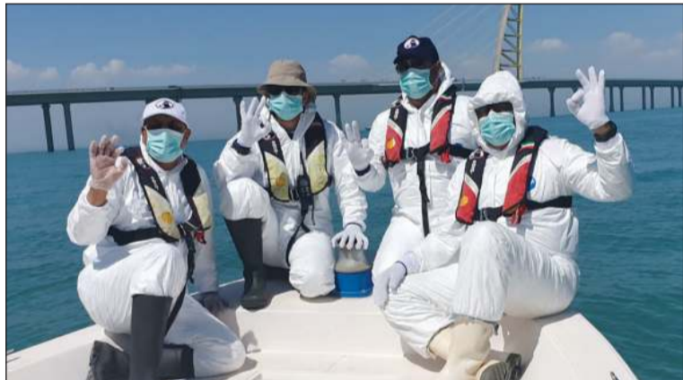
فريق الغوص مستعد لمساعدة الجهات الحكومية

وأخشاياً تؤثر على الملاحة البحرية. وأضاف الشطي أن الفريق على تواصل تام مع جميع الجهات الحكومية المرتبط نشاطها في المجال الساحلي والبحري للتنسيق لأي عمل طارئ، داعياً جميع المواطنين والمقيمين إلى ضرورة الالتزام بالتعليمات الصادرة عن الجهات المعنية وتوخي الحيطة والحذر.