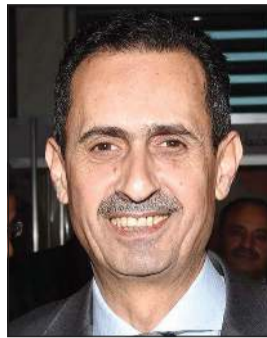
السفير الأردني صقر أبوشتال