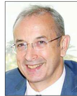
السفير الألماني إيشتيغان موبس

أكد عدد من السفراء لدى البلاد التزام جالياتهم بالتوجيهات الصادرة عن الحكومة في شأن الإجراءات الاحترازية المتعلقة بمنع انتشار فيروس كورونا. وأشار السفراء بجدية هذه الإجراءات التي وصفوها بالمطمئنة، مؤكداً تواصلهم الدائم مع أبناء جالياتهم ومتابعة الأخبار المتعلقة بالمرض وانتشاره وبث الارشادات التوعوية إليهم.