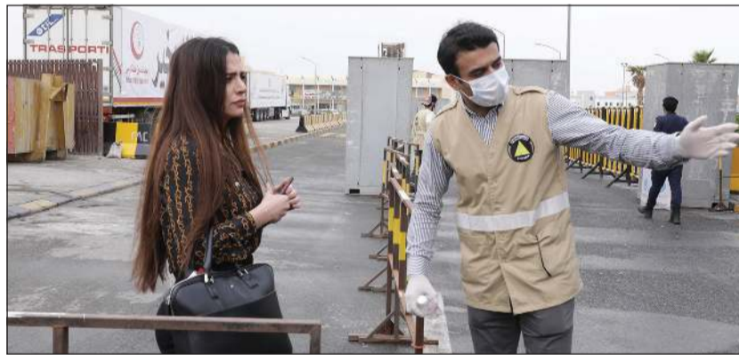
دور بارز لرجال الدفاع المدني