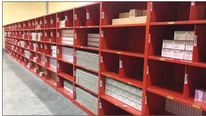
المخزون الإستراتيجي للأدوية والمستلزمات الطبية مطمئن

من القادمين من بريطانيا ومصر وسورية ولبنان