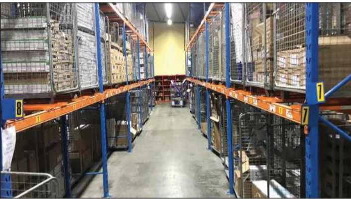
المخزون الإستراتيجي للأدوية والمستلزمات الطبية مطمئن