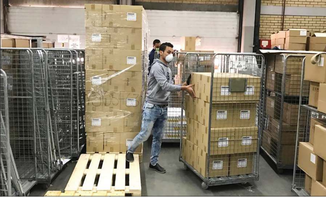
أدوية ومستلزمات طبية

تعزيز ميزانية قطاع الأدوية والتجهيزات الطبية لمواجهة أزمة «كورونا» خطة لقطاع الأدوية والتجهيزات لتوفير كل وسائل الحماية الشخصية للطواقم الطبية