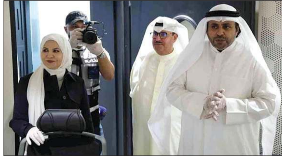
وزير الاعلام محمد الجبري والوكيلة منيرة الهويدي والوكيل المساعد لقطاع الإذاعة الشيخ فهد المبارك أثناء الجولة