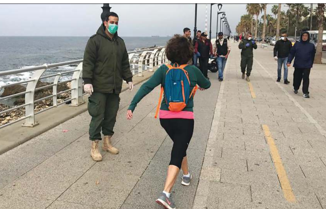
عناصر بلدية بيروت خلال إخلاء الكورنيش البحري في بيروت

ببيروت - عمر حنجر وداود رمال اعلنت الحكومة اللبنانية حالة «طوارئ صحية» على كل الأراضي اللبنانية، ما يعني وضع كل المستشفيات الحكومية والخاصة والمراكز الصحية والمختبرات والمستلزمات الطبية بتصرف وزارة الصحة. وتحدث رئيس الجمهورية ميشال عون إلى اللبنانيين خلال جلسة مجلس الوزراء التي انعقدت في الرابعة من عصر أمس، شارحاً بواعث هذا القرار في مواجهة هذه الازمة الصحية الوطنية. وقد دعا الرئيس عون المواطنين إلى العمل من منازلهم وتفاذي التواصل عن قرب لمنع انتشار الفيروس. وقال في كلمة بثها التلفزيون في بداية اجتماع الحكومة، إن الجميع مدعوون لمواصلة عملهم من بيوتهم بالطريقة التي يرون أنها تناسبهم. وأضاف أنه أمام سرعة انتشار هذا الوباء وعجز العالم عن احتوائه فإن «الحالة الراهنة تؤلف حالة طوارئ صحية تستدعي إعلان حالة تعبئة عامة في جميع المناطق اللبنانية». ويشمل القرار إغلاق جميع الحدود والمنافذ الجوية والبحرية، وإقفال المتاجر والمطاعم والمؤسسات التي استنتجت المؤسسات ذات الطابع الصحي الكندييات ومستودعات الأدوية وتحديد اوقات فتح متاجر المواد