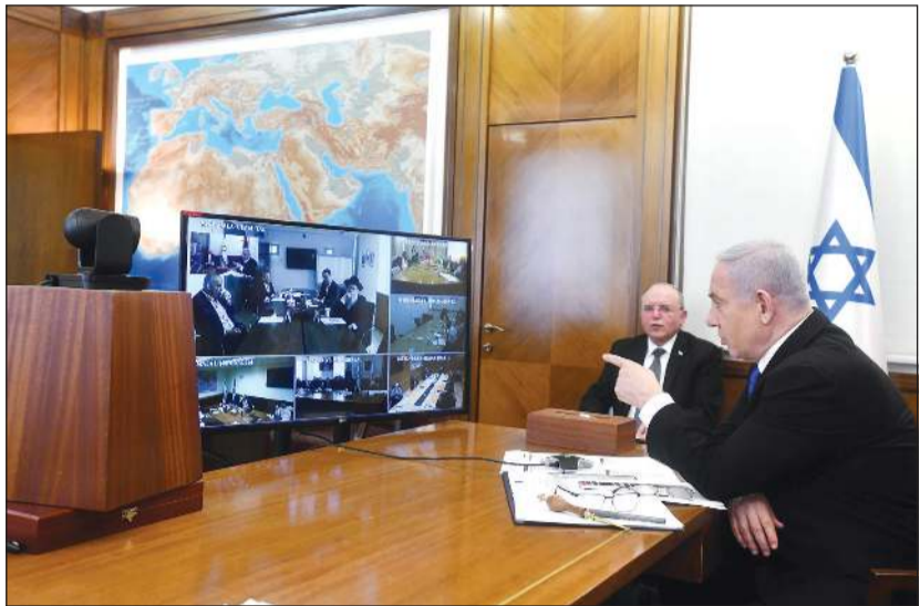
جانب من اجتماع الحكومة الإسرائيلية عبر الفيديو

عواصم - وكالات: بدأ الرئيس الإسرائيلي رؤبين ريفلين، إجراء مشاورات مع ممثلي الأحزاب، لاختيار رئيس الحكومة المقبلة، بعد إخفاق جميع القوائم في الحصول على أغلبية في الانتخابات البرلمانية الأخيرة للمكثنت «البرلمان» تمكنها من تشكيل الحكومة.