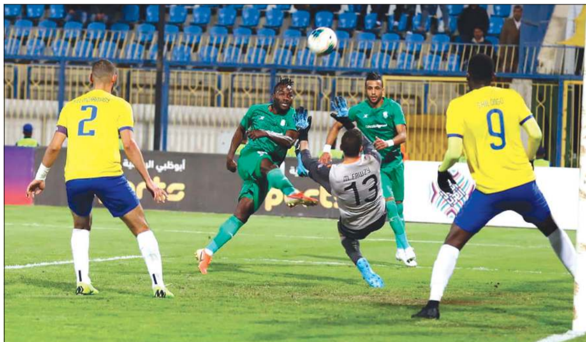
لقطة سابقة من مباراة الاسماعيلي والاتحاد في ربع نهائي البطولة العربية

أمام منتخب توغو يومي 26 و29 من الشهر الجاري. ومع إلغاء الفترة الزمنية التي كانت مخصصة للمعسكر والمبارتين، تدرس لجنة المسابقات باتحاد الكرة المصري، استغلال هذه الفترة لاستكمال دور الـ 16 بكأس مصر، بلقائي الأهلي مع الترسانة، والزمالك مع سموحة، وأيضا المباريات المؤجلة في الدوري، والتي كان محدد لها أمس بين الأهلي وانبي المؤجلة من الجولة 15، واليوم الزمالك بين والمصري