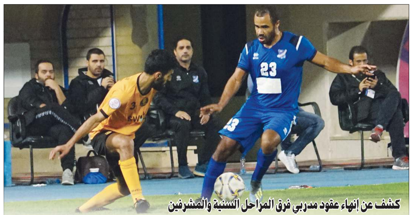
كشف عن إنهاء عقود مدربي فرق المراحل السنية والمشرفين

أعلنت اللجنة الأولمبية القطرية رسميا أمس عن إيقاف جميع الأنشطة الرياضية المحلية اعتبارا من اليوم (الاثنين) حتى 26 من شهر مارس الجاري، بسبب تفشي فيروس كورونا المستجد. وأصدرت اللجنة بيانا ذكرت فيه «استكمالاً للجهود التي تبذلها الدولة لإتخاذ كافة الإجراءات الاحترازية للحد من انتشار فيروس كورونا، وتماشيا مع وزارة الصحة العامة بتجنب التجمعات في الأماكن العامة، تقرر تعليق جميع الأنشطة الرياضية المحلية حتى التاسع والعشرين من مارس الجاري» كما أعلن الاتحاد القطري لكرة القدم رسميا «إيقاف جميع مباريات كرة القدم