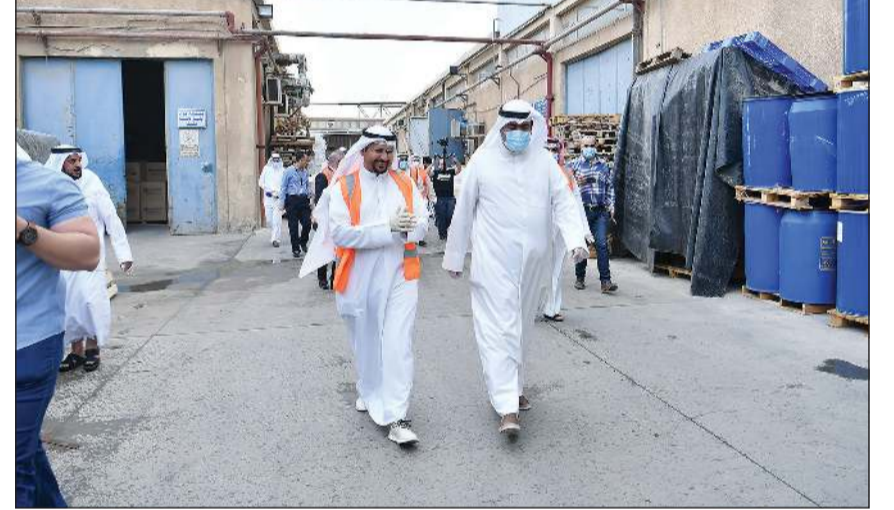
خالد الروضان خلال الجولة على بعض مصانع الكويت

وبسؤال الروضان عن انتقاد البعض له بالعمل الميداني في ظل الأزمة الحالية، قال: لن أرد على أي انتقادات اليوم، ولكن إذا وجد أن الوزير يعطي توجيهات وهو يجلس بالمنزل فلن يقبل بها أحد،