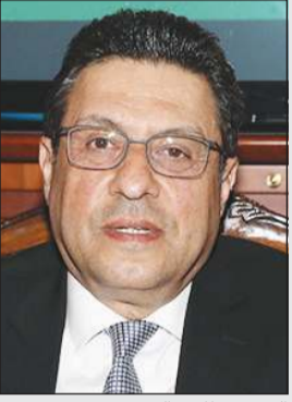
السفير طارق القوني