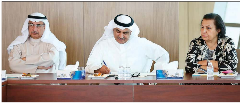
الوزير د. سعود الحربي متوسماً د. رشيد الحمد ود. ثورية الصبيح

وبين أنه على جميع الطلبة في دول الابتعاث المكوث في مقار السكن الخاصة بهم وعدم الخروج إلا للضرورة كما هو متبع في الكويت داعياً الطلبة القاطنين بسكن الجامعة إلى التواصل مع المكاتب الثقافية في تلك الدول في حال إغلاق سكن الطلبة في الجامعة المبتعث إليها. وأضاف أن المكاتب الثقافية بمختلف دول الابتعاث تبذل كل الجهود للتواصل مع الجامعات لمساعدة الطلبة المبتعثين فيها داعياً الطلبة الالتزام بمقرات الابتعاث واتباع كل الإرشادات الصحية المعلن عنها في تلك الدول والمتعلقة وفقاً لمنظمة الصحة العالمية واتباع التعليمات الصادرة من جامعاتهم والمكاتب الثقافية للوقاية من فيروس كورونا المستجد (كوفيد - 19).