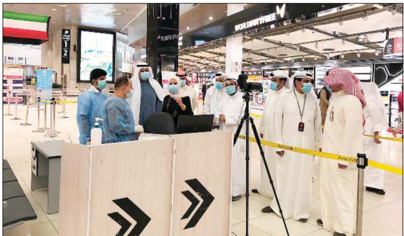
مريم العقيل خلال تفقدها الإجراءات الاحترازية بالمطار

برفقة رئيس الطيران المدني الشيخ سلمان الحمود للاطلاع على سير العمل وتفقد الإجراءات الاحترازية للحد من انتشار فيروس كورونا.