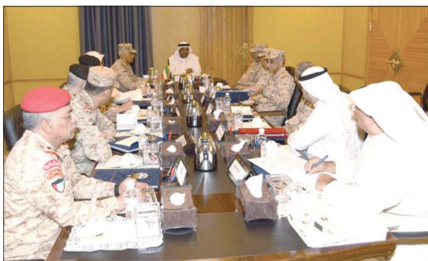
الشيخ أحمد المنصور مترسا الاجتماع بحضور الفريق الركن محمد الخضر وقيادات الوزارة

ترأس نائب رئيس مجلس الوزراء ووزير الدفاع الشيخ أحمد المنصور اجتماعاً صباح أمس بمبنى الوزارة ضم كبار القيادات العسكرية والإدارية، وذلك لمناقشة كل الإجراءات الاحترازية التي تم اتخاذها لتنفيذ قرارات مجلس الوزراء لمواجهة فيروس كورونا المستجد.