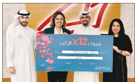
فريق بنك الخليج يعلن الفائز بسحب الراتب الثاني

في الكويت وهي 100 ضعف الراتب. ويمنح حساب الراتب للعملاء الجدد ممن يقومون بتحويل رواتبهم إلى بنك الخليج فرصة الحصول على جائزة نقدية فورية قدرها 100 دينار أو قرض بدون فوائد لغاية 15000 دينار، شرط ألا يقل الراتب الذي يتم تحويله إلى بنك الخليج عن 500 دينار. وبإمكان العملاء الجدد الحصول على بطاقات فيزا و ماستر كارد الائتمانية بدون رسوم سنوية في العام الأول، مع إمكانية الحصول على قرض تصل قيمته إلى 70000 دينار وتسدده خلال مدة 15 سنة، أو قرض استهلاكي تصل قيمته إلى 25000 دينار.