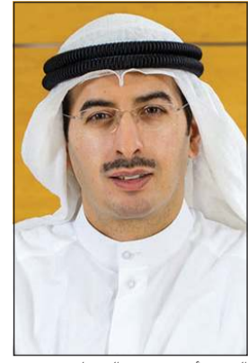
الشيخ أحمد دعيج الصباح

بفيروس كورونا. وأضاف قائلاً إن البنك التجاري وضمن المبادرات الاستراتيجية التي يحرص عليها باعتباره أحد أقدم البنوك الكويتية تأسيساً وداعماً للمشاريع التنموية في البلاد، لا يدخر جهداً في اتخاذ أي تدابير أو إجراءات يكون من شأنها المساهمة في مثل هذه المبادرات الوطنية التي تجسد روح التعاون بين البنوك المحلية وحكومة الكويت. وفي سياق متصل، أشار الشيخ أحمد الصباح إلى الإجراءات المرتبطة بمكافحة هذا الفيروس داخل البنك وبالفرع، والتي اشتملت على إبقاء موظفي البنك على اطلاع بكل المستجدات المرتبطة بالفيروس، ونشر الإرشادات والتوجيهات الصادرة من وزارة الصحة