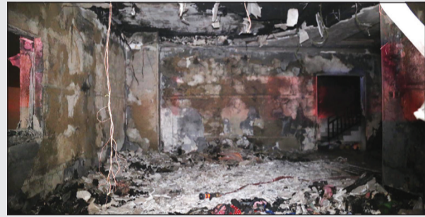
الحريق الهائل أتى على محتويات المنزل بالكامل

قال مصدر مطلع في الادارة العامة للأطفاء ان التقرير النهائي بشأن سبب الحريق جار الانتهاء منه، لافتا الى أن جهات اخرى تشارك في اعداد التقرير منها وزارة الداخلية والنيابة العامة.