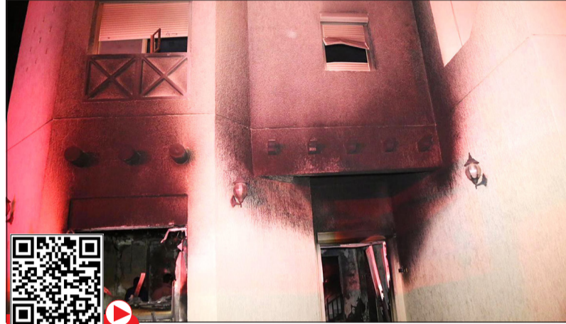
آثار الحريق على واجهة المنزل