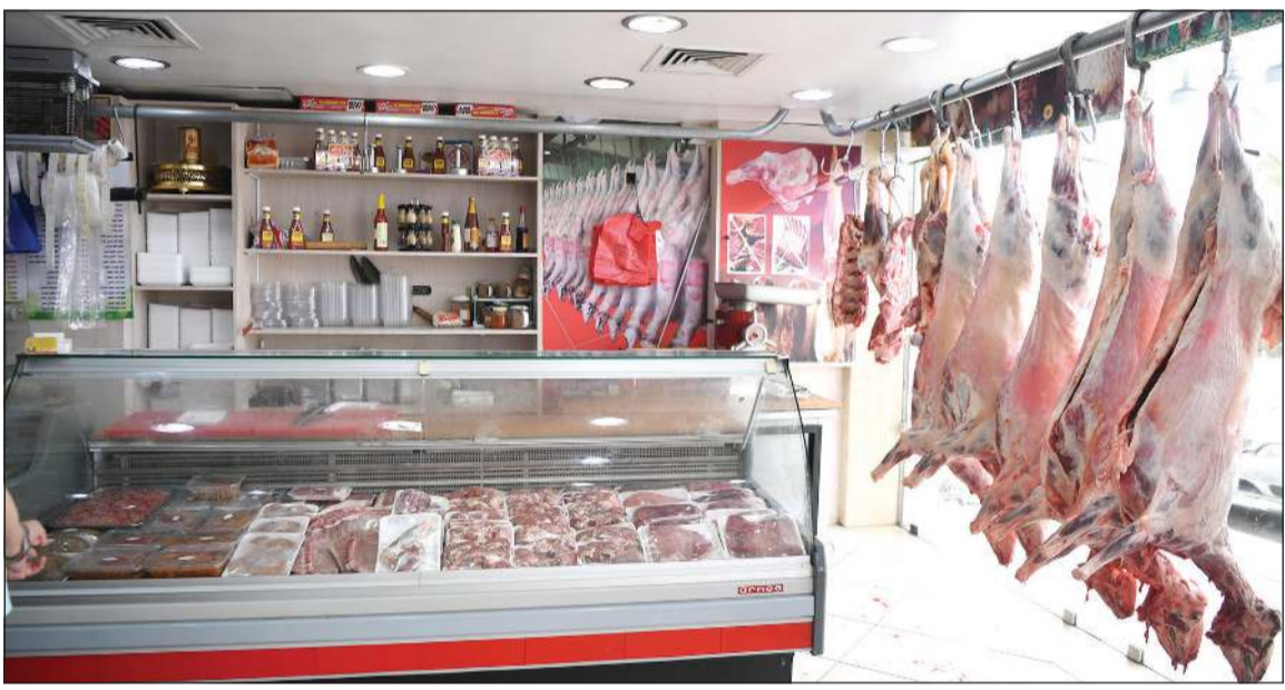
ركود كبير في أسواق اللحوم