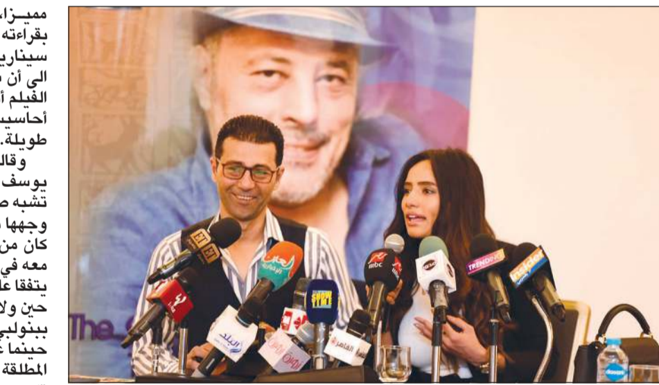
زينة في المؤتمر

محمد أمين من أكثر المخرجين الذين أحب العمل معهم، فأسلوبه في التعامل مع الفنانين جميل جداً، وكانت تجربتي الأولى معه من خلال «بناتين من مصر» والذي رفضته في البداية لأن إحدى النجمات قالت لها إنه ليس