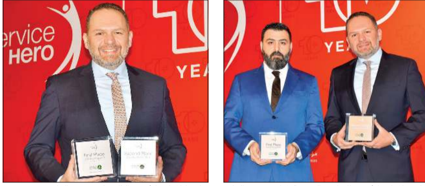
جائزة المركز الأول والجائزة الفضية لمطعم ميس الغانم