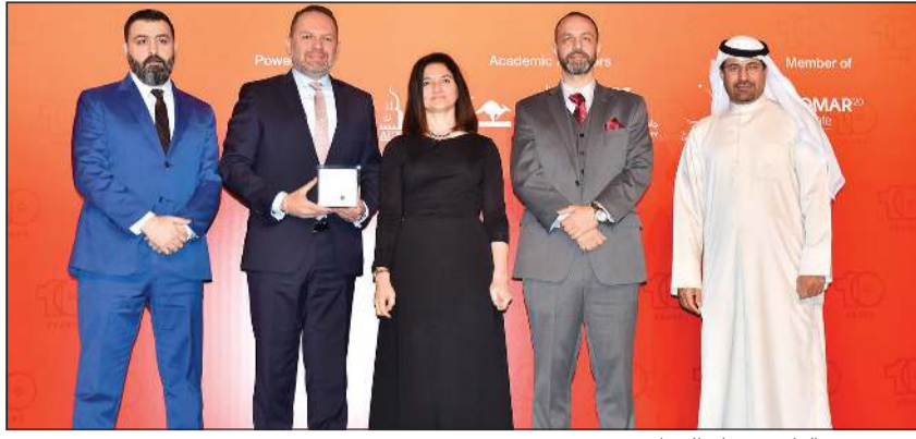
فريق «ميس الغانم» يتسلم الجوائز