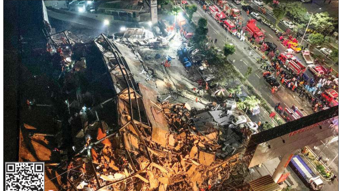
مقذون يبحثون عن ناجين تحت انقاض الفندق - المجر الذي انهار في كوانزو

كما سيكون المرور عبر المنافذ البرية بين المملكة وتلك الدول للشاحنات التجارية فقط. على أن تتخذ وزارة الصحة جميع الإجراءات الإحترازية اللازمة في المطارات المشار إليها، وكذلك حيال سائقي تلك الشاحنات ومرافقيهم في المنافذ البرية، حيث يبدأ تطبيق هذه الإجراءات فوراً. وأضاف المصدر أنه وبالنسبة لدخول