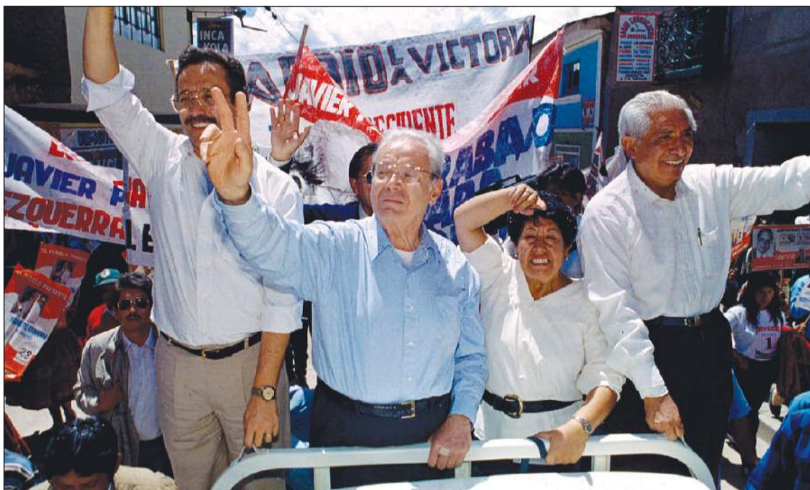
استقبال حافل لدي كويبار خلال حملته للرئاسة في بيروت عام 1995