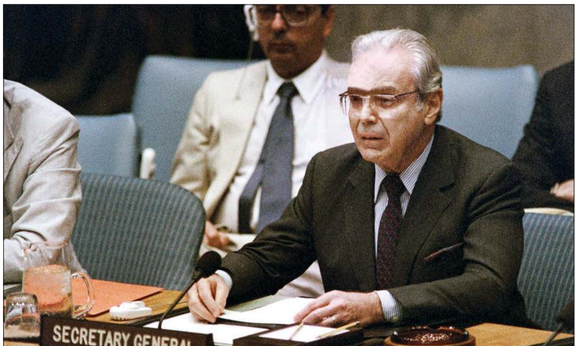
الراحل خافيير دي كويبار في الأمم المتحدة