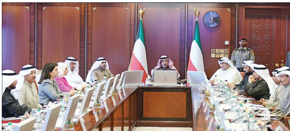
سمو الشيخ صباح الخالد مترشدا اجتماع مجلس الوزراء

تكليف هيئة الصناعة بالتنسيق مع الجهات الحكومية المعنية والقطاع الخاص لاتخاذ الإجراءات نحو زيادة الطاقة الإنتاجية وتشغيل المصانع المحلية لصناعة الكمامات ومواد التعقيم