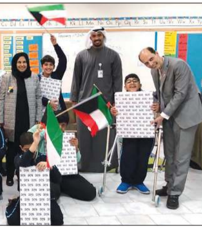
جانب من فعاليات stc في المدارس