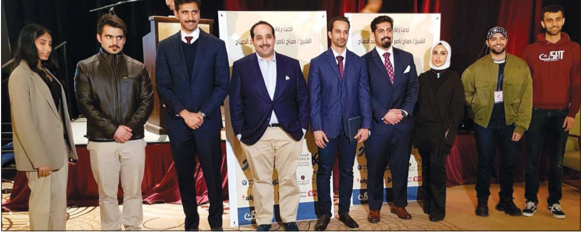
الشيخ صباح ناصر صباح الأحمد مع عدد من المشاركين بالملتقى

اختتم بنك برقان رعايته للملتقى «سنيار» بالتعاون مع منظمة الطلبة الكويتيين في «Temple University» في مدينة فيلادلفيا بالولايات المتحدة الأمريكية بمناسبة الأعياد الوطنية، وكان الاحتفال تحت رعاية وحضور الشيخ صباح ناصر صباح الأحمد. وخلال الملتقى، كان هناك حضور كبير من الطلبة الكويتيين من عدة جامعات، كما تضمن الملتقى العديد من الفعاليات الترفيهية والثقافية للطلبة مع حضور بعض الشخصيات المميزة للاحتفال بعيدى الوطني والتحرير. والهدف من هذا الملتقى أن يكون منصة لتطوير الكفاءات الشبابية ومساعدة الطلبة في التواصل والتعاون فيما بينهم. ومن خلال هذه الفعالية، يؤكد بنك برقان على دوره الريادي في دعم المبادرات الوطنية، وتمكين الشباب وتفعيل دورهم في المجتمع، كما يحرص البنك على الاستثمار في الطاقات الشبابية ودعم التعليم لخلق جيل مثقف وواع تماشياً مع رؤية الكويت 2035. وسيستمر بنك برقان في دعم العديد من المبادرات والأنشطة التي تخدم تطلعات وطموح جيل الشباب لتحقيق التنمية المستدامة ضمن توجيهات سمو الأمير. وتندرج هذه المبادرة ضمن برنامج بنك برقان الاجتماعي تحت عنوان «ENGAGE»، «معاً لتكون التغيير»، الهادف إلى تسليط الضوء على الجوانب المهمة والمؤثرة في المجتمع، إضافة إلى تعزيز مسؤوليته الاجتماعية من خلال دعم المبادرات الإيجابية ضمن استراتيجيته للمسؤولية الاجتماعية. ويأتي نهج حملة «ENGAGE» تماشياً مع مبادئ بنك برقان، كمؤسسة مالية كويتية رائدة، بحيث ينسجم أسلوب سياساته مع احتياجات ومصالح المجتمع.