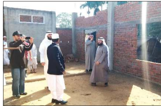
العقيل يشرف على بناء الأعمال الإنسانية