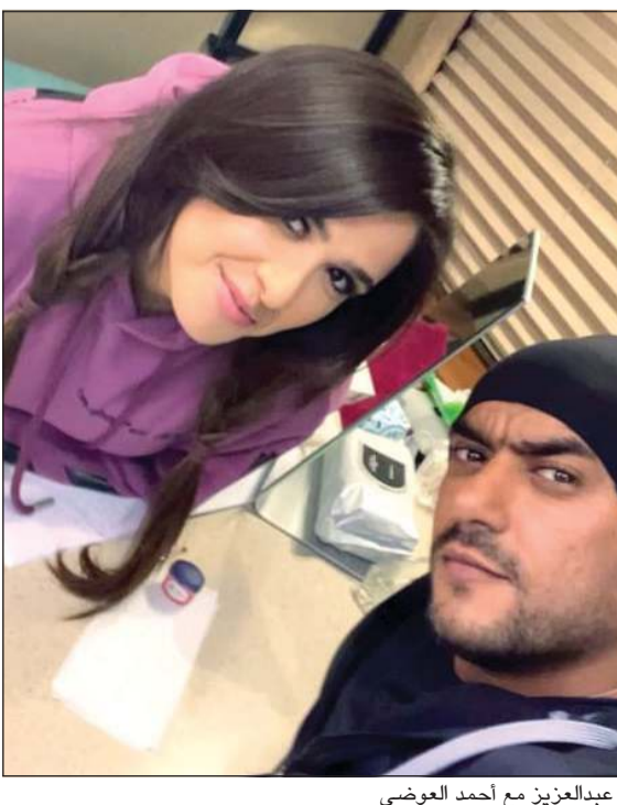
ياسمين عبدالعزيز مع أحمد العوضي

انتقد شقيق ياسمين عبدالعزيز علاقته بالفنان أحمد العوضي، وذلك في منشور له عبر «فيسبوك»، ليعيد إلى الأذهان الكثير من الأقاويل التي انتشرت حول ارتباط ياسمين بالعوضي الذي شاركها في «الملكة». وظهر العوضي مع ياسمين في عيد ميلادها، والنقاط معظم صور الحفل معاً، ثبتت الشائعة، ليأتي شقيق ياسمين ويؤكد ارتباطها باليوسف الذي نشره بـ «فيسبوك»، بسبب علاقتهما، قائلاً: «بص يا ياسمين يا عبدالعزيز يا أختي، أنا معاك وفي صهرك من وانتي صغيرة، شيلت مشاكل كثير بسببك، من وانتي عيلة صغيرة». واستكمل: «لكن هتروحي تعرفي واحد أصغر منك بـ 10 سنين، وتتصورني صور مالهش أي لزمة على حساب سمعتك ومسعتنا، لا ومحدث هيسمج، من إمتي وإحنا بنععمل أعياد ميلاد، وتنزل على السوشيال ميديا؟ من إمتي الناس بتجيب في سيرتنا؟ ونقعد نتعكس على السوشيال ميديا، ومع ذلك حياتك وانتي حرة فيها».