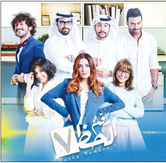
مسلسل «رقم الحظ 7»

لها تواجد كبير وتحصد نجاحات، والدليل نجاح «دفعة القاهرة» الذي كان بطولة شبابية، وبالنسبة لي أهتم أن تكون القصة مناسبة والشخصيات مكتوبة بعناية مع وجود مخرج واع وأبطال متميزين، فإذا لم يكن العمل مناسباً للشباب قد يفشل، مكملاً: لا يمكن أن ننسى نجومنا الكبار «اللي مالنا غنى عنهم وعن خبرتهم»، فمشاركتهم في أي عمل درامي هو إضافة قوية لأنهم مروا بتجارب كثيرة في حياتهم المهنية، كما أن هناك أدواراً معينة لا تصلح إلا لهم، ويكفيها وفهم معنا وتوجيههم وتوجيهاتهم التي نستفيد منها من دون شك.