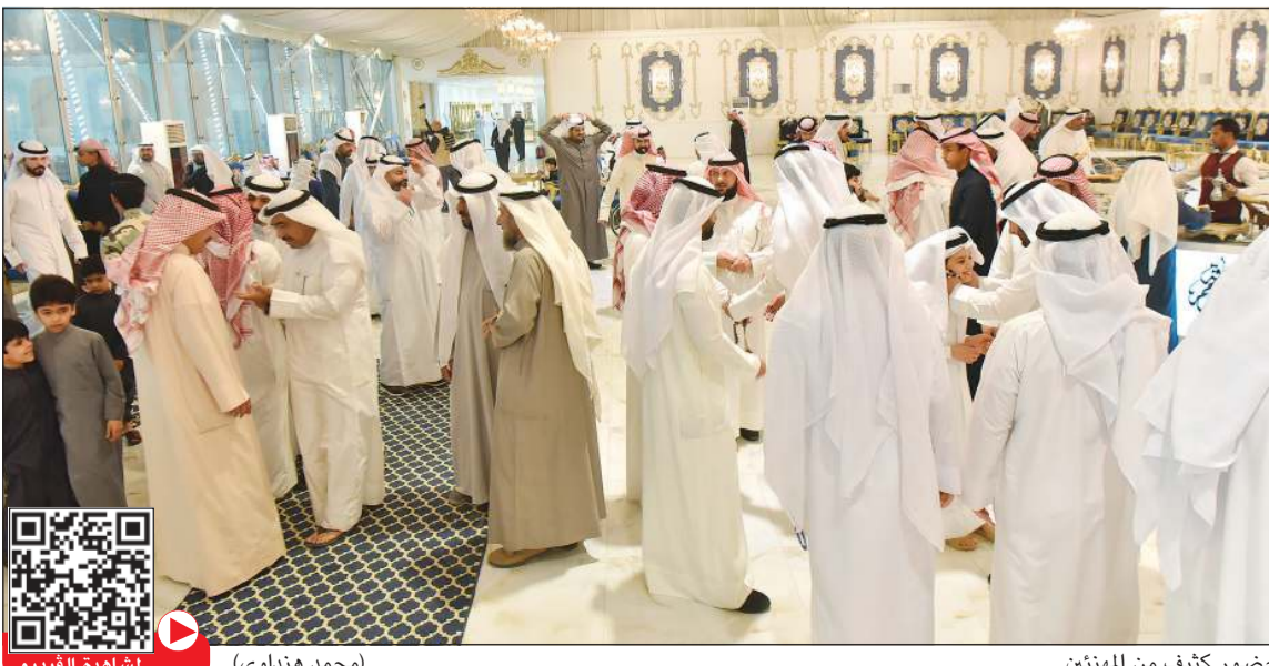
حضور كثيف من المهنيين

قال ممثل إحدى صالات الأفراح ان الحجوزات تسير وفق توارخها ومواعيدها المحددة وكذلك الحجوزات الخاصة بحفلات العشاء والتخرج لم يطرأ عليها أي تغيير بسبب تداعيات فيروس كورونا، وبالعكس هناك من يطلب لنا تقديم موعد زفافه وبالتالي فإن صالات الأفراح لم تتأثر بانتشار الفيروس. وأشار أحد أصحاب قاعات الأفراح إلى عدم وجود نية حتى الآن لإغلاق القاعة ومن يريد إلغاء حزن العرس الخاص به فنحن لا نمانع، والحجوزات التي لدينا لم يتم إلغاء أي منها حتى الآن ولكن تم إلغاء حالة واحدة بسبب وفاة أحد أقارب المرص.