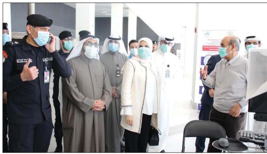
الوزيرة مريم العقيل خلال جولتها في مطار الكويت

والتقت خلال الزيارة مع عدد من المراجعين واستمعت لمطالبهم واقتراحاتهم لتسهيل إنجاز المعاملات، ووعدت بتذليل كل العقبات وكل ما يعرقل إنجاز المعاملات بسهولة ويسر، كما التقت العقيل مع مسؤولي الهيئة والموظفين مقدمي هذه الخدمات واستمعت إلى آرائهم، حيث قامت الوزيرة بزيارته لعدد من الإدارات وأيضا