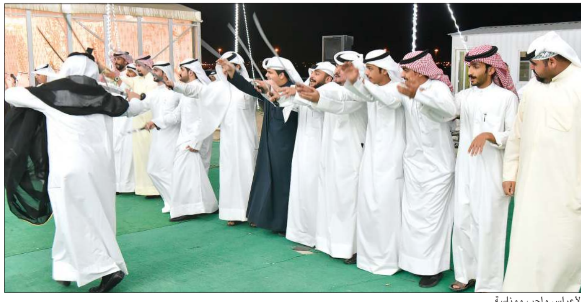
الأعراس واجب ووناسة