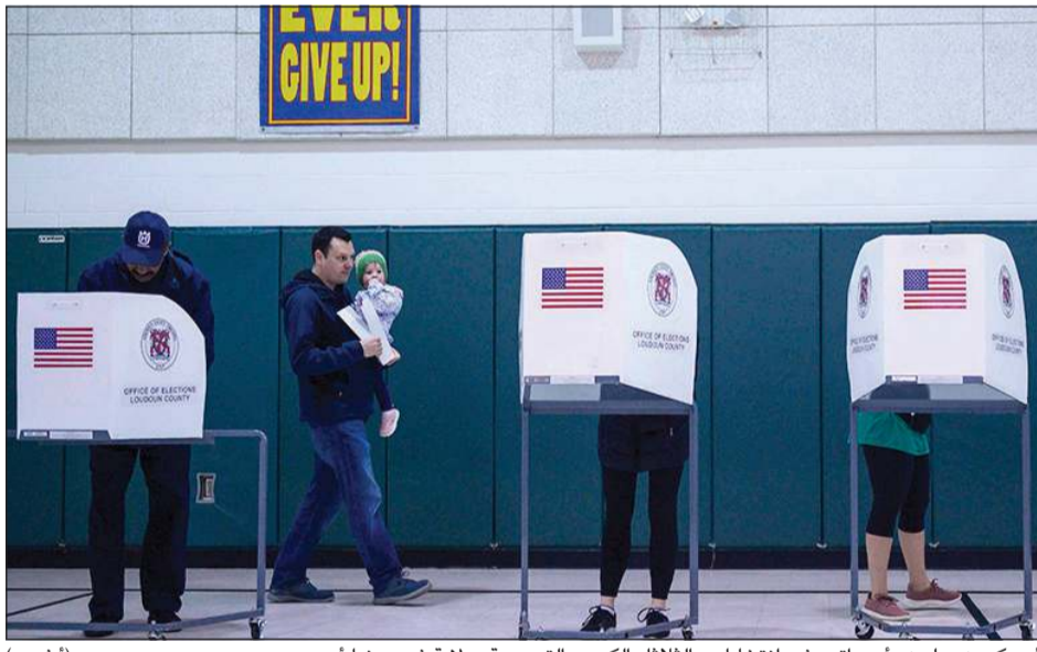
أمريكيون يدلون بأصواتهم في انتخابات «الثلاثاء الكبير» التمهيدية بولاية فلوريدا أمس

لا يزال في المرتبة الثالثة خلف ساندرز وبايدن. وفي حال فشل بلومبرغ في استحقاق «الثلاثاء الكبير»، سيكون الباب مشرعاً لبايدن أمام الوسط، إذ سيظهر في موقع الحاجز المعتدل الوحيد أمام «الاشتراكي» ساندرز في بلد لاتزال هذه الصفة تذكر فيه بحقبة الحرب الباردة والشيوعية. في غضون ذلك، وجه الرئيس دونالد ترامب انتقادات جديدة للانتخابات التمهيدية للديموقراطيين، معتبراً أنها «مزورة» ضد متصربها بيرني ساندرز. وقال ترامب في تصريح أدلى به في حديقة البيت الأبيض قبيل توجهه إلى كارولينا الشمالية للمشاركة في حملة انتخابية أمس «إنها مزورة ضد بيرني، لا شك في ذلك». من جهة أخرى، سخر ترامب من جو بايدن الذي قال في هفوة سابقة، إن نصف بلدنا قتل في أعمال عنف بالأسلحة النارية.