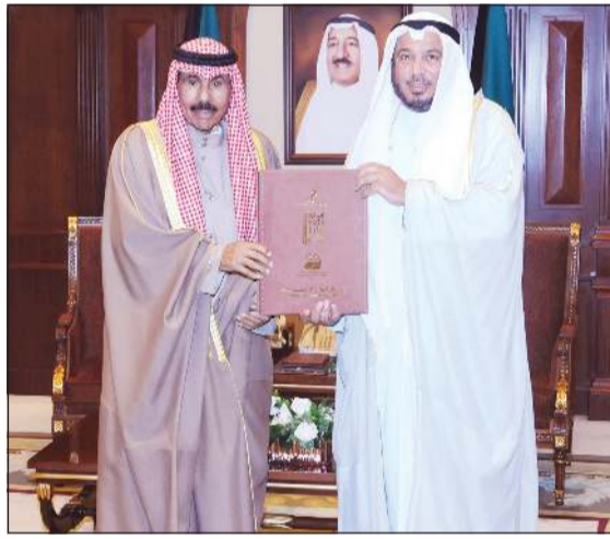
سمو ولي العهد الشيخ نواف الأحمد يتسلم التقرير من د.عبدالله المعنوق

تقرير البرامج والأنشطة لعام 2019) لمبادرة إطعام مليار جائع حول العالم والمنبثقة من المؤتمر السنوي للغانم للشراكة الفعالة من أجل عمل إنساني أفضل.