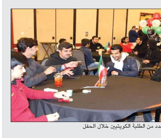
عدد من الطلبة الكويتيين خلال الحفل

قال ديوان المحاسبة الكويتي إنه استضاف أمس الأحد رئيس ديوان المحاسبة القطري الشيخ بندر بن محمد آل ثاني لتكثيرة وتعزيز التعاون المشترك بين الجانبين. وأوضح الوكيل المساعد لقطاع الشؤون الإدارية والمالية وتقنية المعلومات في الديوان عصام المطيري أن الزيارة تضمنت