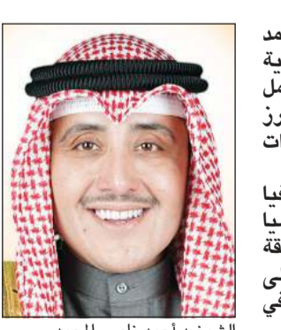
الشيخ د.أحمد ناصر المحمد

تلقي وزير الخارجية الشيخ د.أحمد ناصر المحمد ظهر أمس اتصالاً هاتفياً من وزير خارجية جمهورية تركيا الصديقة مولود تشاوشووش أوغلو تناول مجمل العلاقات الوثيقة التي تربط البلدين الصديقين وأبرز المستجدات على الساحتين الإقليمية والدولية والتطورات الراهنة في المنطقة. وكان الشيخ د.أحمد ناصر المحمد أجرى اتصالاً هاتفياً مساء أول من أمس مع وزيرة خارجية جمهورية إندونيسيا الصديقة ريتنو مارسودي تناول مجمل العلاقات الوثيقة التي تربط البلدين الصديقين وأبرز المستجدات على الساحتين الإقليمية والدولية والتطورات الراهنة في المنطقة.