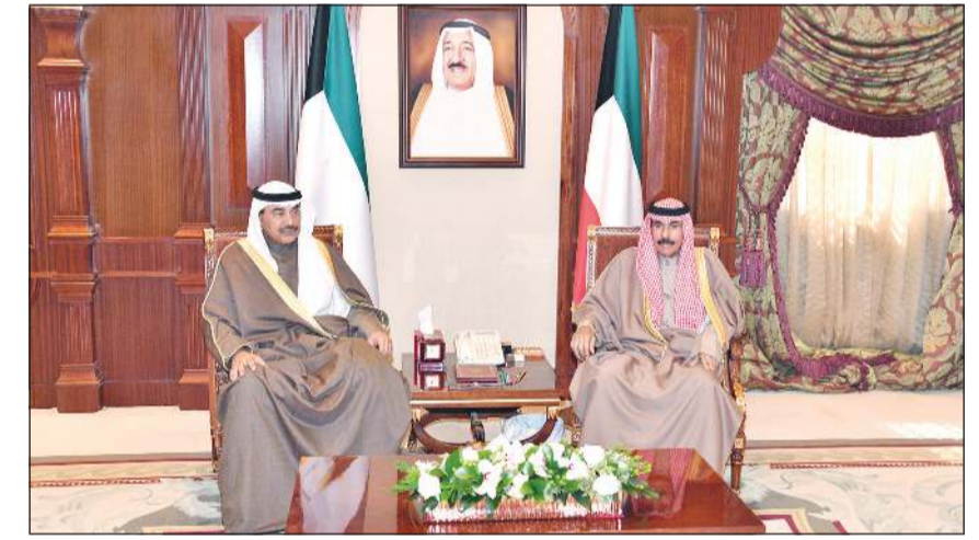
سمو ولي العهد الشيخ نواف الأحمد مستقبلاً سمو الشيخ صباح الخالد

رئيس الهيئة الخيرية الإسلامية العالمية والمستشار الخاص للأمير العام للأمم المتحدة السنوي في الديوان الأميري د.عبدالله المعنوق، حيث سلم سموه نسخة من