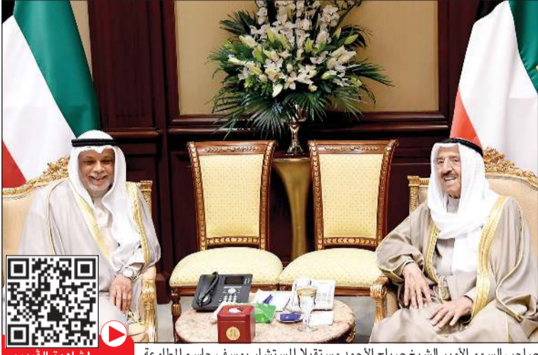
صاحب السمو الأمير الشيخ صباح الأحمد مستقبلاً المستشار يوسف جاسم المطاوعة