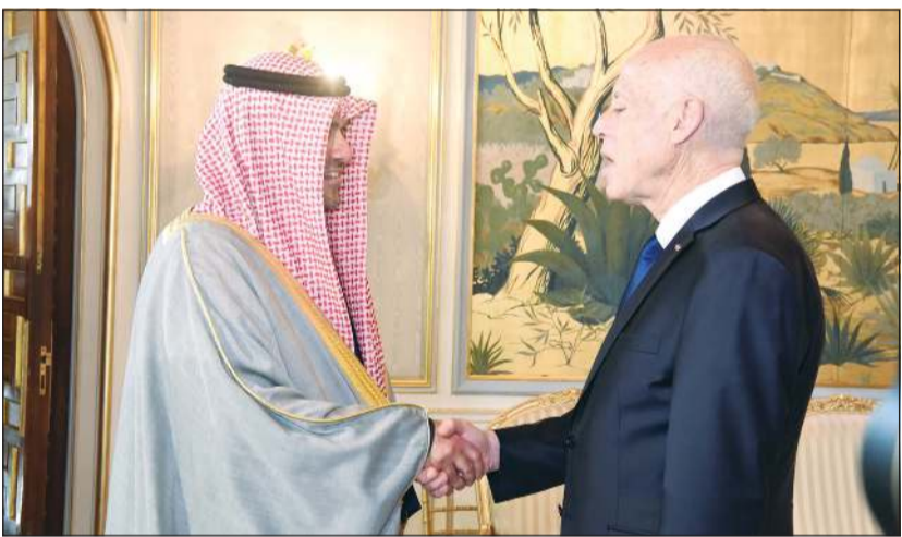
الرئيس التونسي قيس سعيد مستقبلاً أنس الصالح

والاستقرار في الوطن العربي. وحمل الرئيس التونسي الوزير الصالح تحياته وتقديره لصاحب السمو الأمير الشيخ صباح الأحمد وتمنياته لسموه بدوام الصحة وموفور العافية وللشعب الكويتي بالتقدم والازدهار بمناسبة ذكرى الأعياد الوطنية. من جانبه، نقل الوزير أنس الصالح للرئيس التونسي تحيات صاحب السمو، متمنياً للرئيس سعيد ولتونس دوام التقدم والرقي. وجرى خلال اللقاء تبادل وجهات النظر بشأن المسائل الدولية والمستجدات الإقليمية وتطورات الأوضاع بالمنطقة العربية.