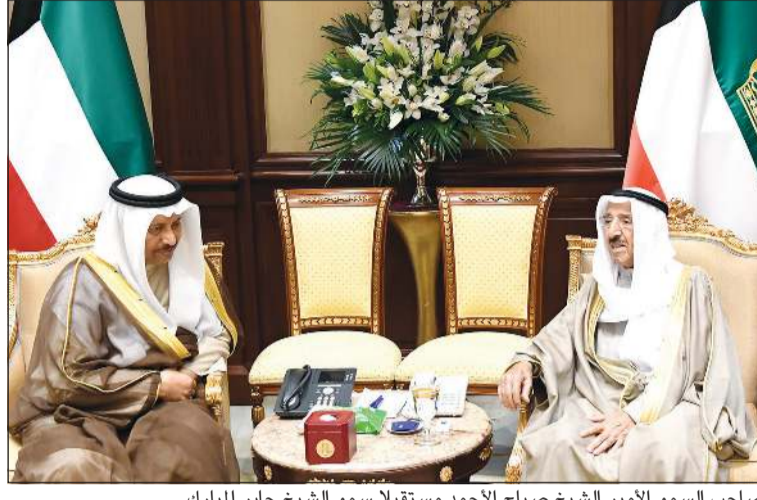
صاحب السمو الأمير الشيخ صباح الأحمد مستقبلاً سمو الشيخ جابر المبارك