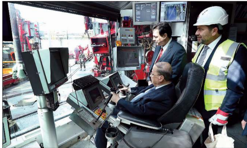
الرئيس اللبناني عون يُطلق إشارة البدء بحفر البئر النفطية الأولى بحضور رئيس الحكومة حسان دياب (محمود الطويل)

أطلق الرئيس ميشال عون إشارة بدء الحفر النفطي في ساحل منطقة كسروان أمس بحضور رئيس الحكومة حسان دياب ووزير الطاقة ريمون عجر، وذلك من على متن باخرة الحفر «تاناغستان اكسفورد» الفرنسية.