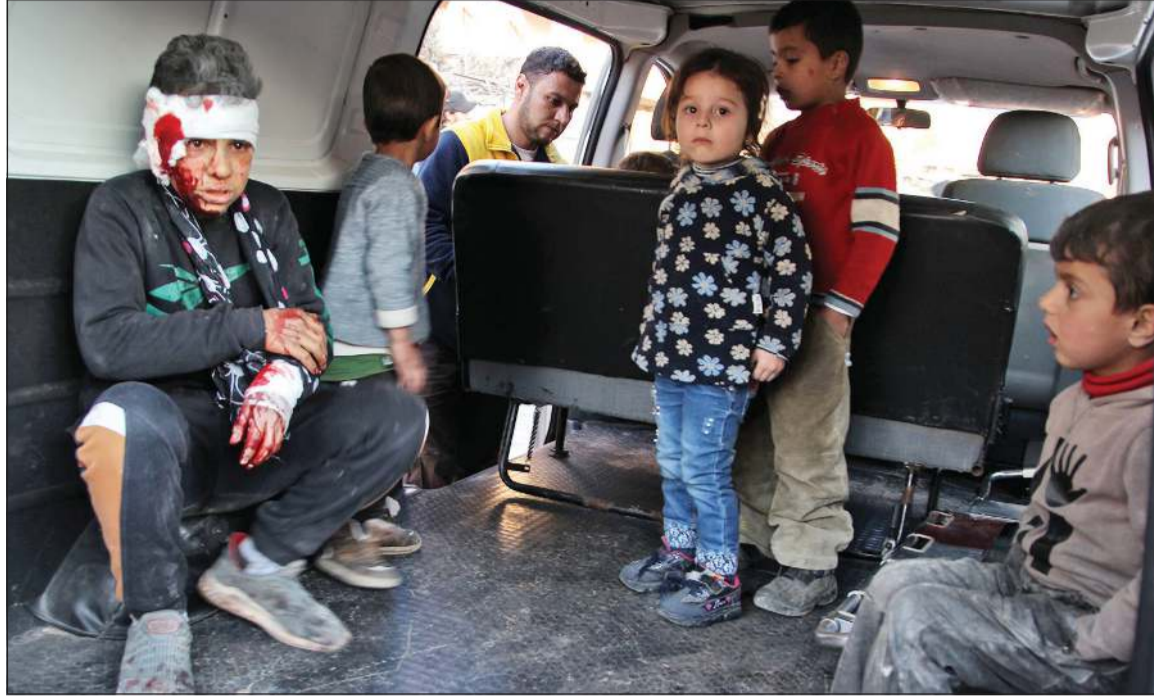
اطفال سوريون جرى انقاذهم من الغارات على بلدة معرة مصرين في ريف ادلب

عواصم - وكالات: قال الرئيس التركي رجب طيب أردوغان إن تركيا تعتزم «طرد قوات الحكومة السورية إلى ما وراء مواقع المراقبة العسكرية التركية والحدود التي وضعناها» في منطقة إدلب وريفها بنهاية فبراير. وقال في كلمة أمام أعضاء البرلمان عن حزب العدالة والتنمية الحاكم إنه يأمل حل مسألة استخدام المجال الجوي في إدلب قريباً، متعهداً بعدم التراجع «قيد أنملة» وسنعمل على عودة النازحين إلى منازلهم.