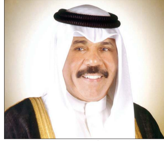
سمو ولي العهد الشيخ نواف الأحمد

استقبل سمو ولي العهد الشيخ نواف الأحمد في قصر بيان صباح أمس الشيخ د. إبراهيم الدعيج.