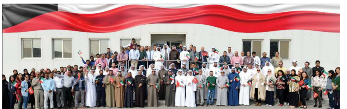
لقطة تذكارية خلال الاحتفال بالأعياد الوطنية