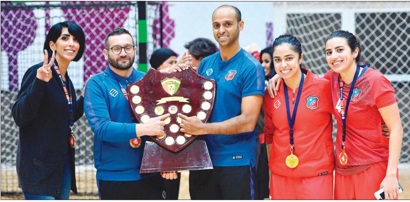
بلسم الأيوب تحتفل بدروع الدوري مع الجهاز الفني ولاعبات الفريق

حيات: الكرة النسائية شهدت تطوراً ملحوظاً واهتماماً من قبل الأندية