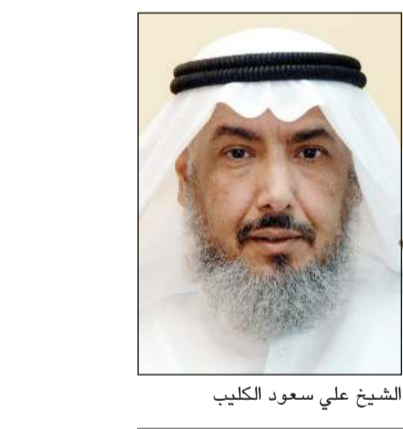
الشيخ علي سعود الكليب

شخص تاجر موسر ويريد ان يخرج زكاة ماله وله أخ لا تلزمه نفقته وهو طالب علم فقير منزحل عنه فهل يحق له أن يعطيه؟ ● اطلعت الهيئة على هذا السؤال وافادت بأنه قد جاء في رد المحتار في باب المصرف بالجزء الثاني ضمن كلام ما نصه: «وقيد بالولادة لجاوزه - اي دفع الزكاة - لبقية الاقارب كالأخوة والاعمام والأخوال الفقراء، بل هم أولى لأنه صلة وصدقة وفي الظاهرية ويبدأ في الصدقات بالاقارب ثم الموالي ثم الجيران ولو دفع الزكاة إلى من نفقته واجبة عليه من الاقارب جاز اذا لم يحسبها