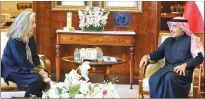
الشيخ د. أحمد ناصر المحمد مستقبلا سفيرة فرنسا ماري ماسدوبوي

خلال اللقاء بجهودها وإسهاماتها في دعم وتعزيز العلاقات الثنائية الوطيدة التي تربط بين البلدين الصديقين. وحضر اللقاء نائب مساعد وزير الخارجية لشؤون وزير الخارجية المستشار أحمد الشريم وعدد من كبار مسؤولي وزارة الخارجية.