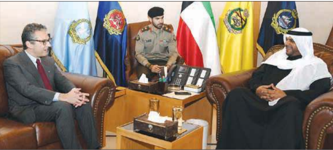
الشيخ أحمد المنصور والسفير الإيطالي كارلو بالدوتشي خلال اللقاء

بحث نائب رئيس مجلس الوزراء ووزير الدفاع الشيخ أحمد المنصور أمس، مع سفير جمهورية إيطاليا الصديقة لدى البلاد كارلو بالدوتشي أهم الموضوعات ذات الاهتمام المشترك. وذكرت مديرية التوجيه المعنوي والعلاقات العامة بالوزارة في بيان صحافي أن الشيخ أحمد المنصور أشاد خلال استقباله للسفير بالدوتشي بعمق العلاقات بين البلدين الصديقين. وحضر اللقاء نائب رئيس الأركان العامة للجيش الكويتي الفريق الركن الشيخ خالد الصالح وعدد من كبار الضباط القادة بالجيش.