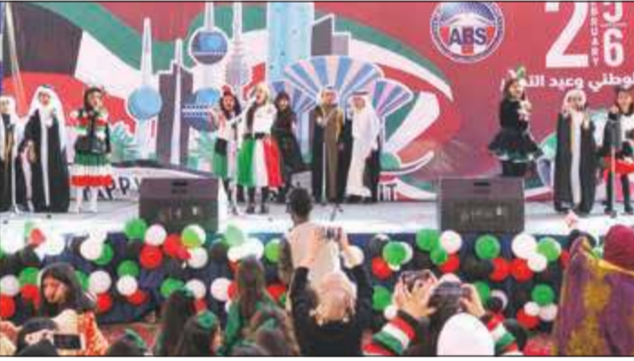
جانب من حفل مدرسة البكالوريا الأمريكية