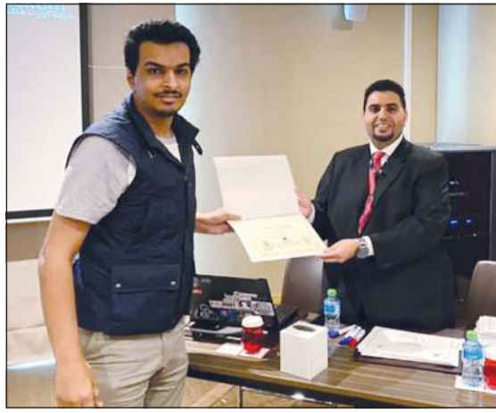
أحد المشاركين يتسلم شهادة حضور البرنامج