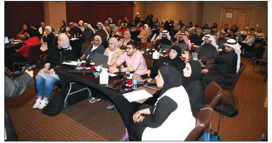
المشاركون في البرنامج التدريبي تعرفوا على سبل تحقيق الأمن السيبراني (محمد هاشم)