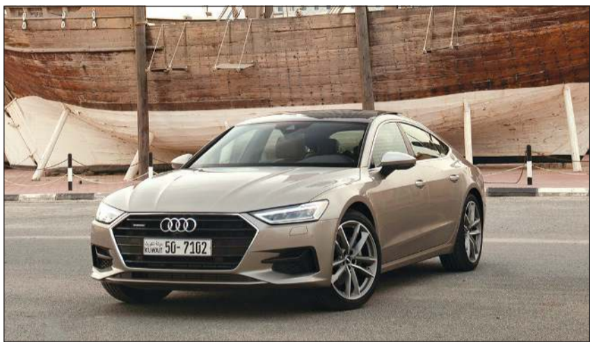
أودي Sportback A7