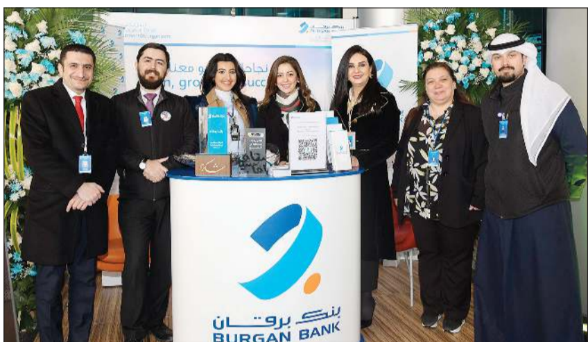
فريق عمل بنك برقان

سلسلة نقاشات تناولت التحديات المستقبلية، وما يبحث عنه في الموظفين الجدد، كما تطرقت النقاشات إلى فوائد الانضمام إلى القطاع الخاص. وقدم الطلاب سيرتهم الذاتية واهتماماتهم الوظيفية من خلال معرض QR التوظيف عبر استخدام CODE الموجود في جناح العرض الخاص في البنك.