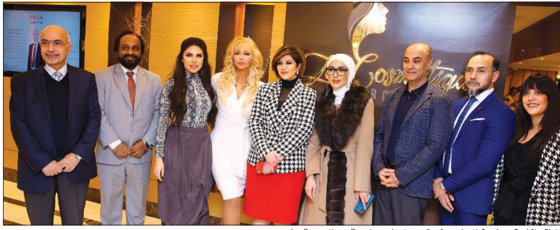
لقطة تذكارية بمناسبة افتتاح مركز التجميل باسم La Cosmetique Royale