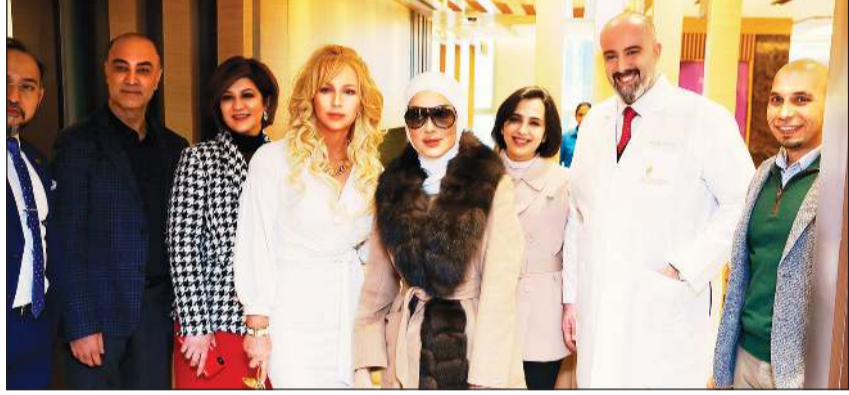
جانب من افتتاح مركز مركز La Cosmetique Royale في رويال حياة

بأطبائنا المتميزين وفريق العمليات الجراحية ونوعية الرعاية الصحية التي نقدمها. لقد كان وسبقي التركيز على المرض هو توجيهنا الرئيسي، ونفخر بعلامة الاعتماد المرموقة من قبل المؤسسة الكندية الدولية للاعتماد. وقد حصل مستشفى رويال حياة على جائزة أفضل مستشفى في الكويت من قبل سيرفيس هيرو للعام التاسع على التوالي بالإضافة إلى الاعتماد الكندي الذهبي.