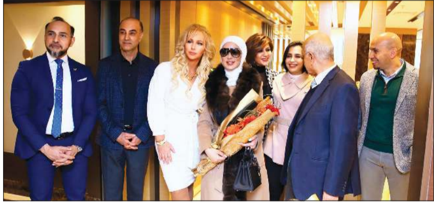
من الحضور خلال الافتتاح