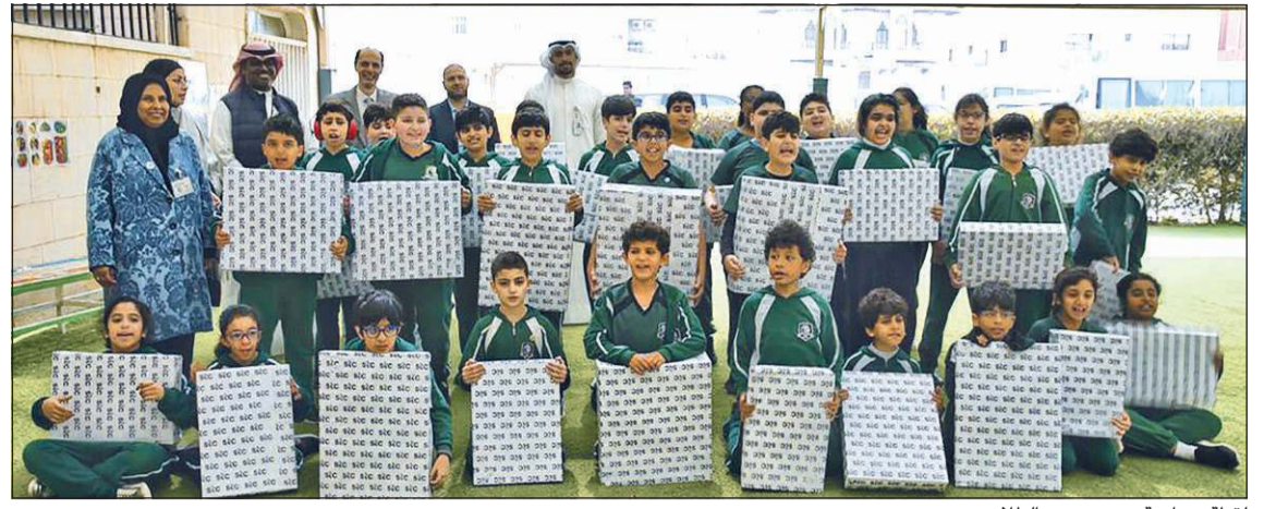
لقطة جماعية مع عدد من الطلاب

بمناسبة العيد الوطني وعيد التحرير، يقدم فندق سفير الفنتاس - الكويت عروضاً مميزة للإقامة في غرفه وأجنته وشققه الفندقية للاستمتاع بأجواء العيد، مليئة بذلك كل احتياجات أفراد العائلة، وتتضمن العروض خصماً مقداره 26% على الخدمات التالية من 25 إلى 29 فبراير 2020: - خصم 26% على الإقامة في جميع أنواع الغرف، الأجنحة والشقق الفندقية العائلية عند الحجز المباشر مع الفندق. - خصم 26% في مطعم الروشنه للمأكولات الكويتية التقليدية والذي يقدم الغذاء والعشاء في أجواء عصرية. - خصم 26% في مطعم فيلوفرز للبرغوث العالمي للإقطار والعشاء. - خصم 26% لليالي الشواء (الباربيكيو) في حديقة الشاطئ.