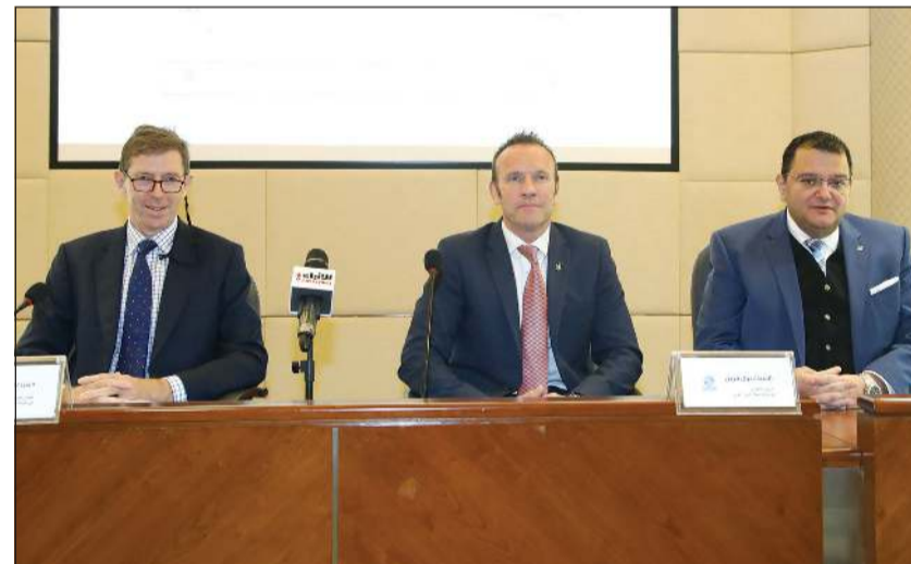
جانب من عمومية شركة شمال الزور الأولى (ريليش كومان)

ووافقت العمومية غير العادية أيضا التي عقدت أمس بنسبة حضور 50.1٪، على توصية مجلس الإدارة بإضافة فقرة جديدة برقم (حادي عشر) للمادة (49) من النظام الأساسي للشركة للسماح بتوزيع أرباح مرحلية طبقا لنص المادة 226 من قانون الشركات رقم 1 لسنة 2016 وتعديلاته، وعلى تعديل المادة 56 من النظام الأساسي للشركة لتصحيح الإشارة إلى القوانين ذات الصلة. وأثناء الاجتماع، أعرب الرئيس التنفيذي في شركة