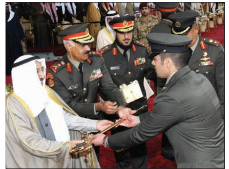
صاحب السمو الأمير الشيخ صباح الأحمد مكرما أحد الخريجين

وأحدنا متسارعة تلقي بظلالها على واقعنا المحلي بشكل أو بآخر لا سيما على الأصدمة الأمنية والاقتصادية والاجتماعية. ومما لا شك فيه فإن العلم أصبح قوة هائلة ومؤثرة في حياتنا اليوم وقد تقدمت بالعلم دول وشعوب وصلت إلى أعلى مستوى حضاري وتفاعست دول أخرى عن الأخذ بأسباب العلم فتخلفت عن الركب.