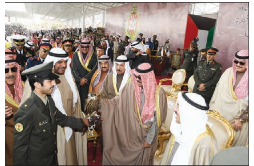
هدية تذكارية لسمو ولي العهد الشيخ نواف الأحمد