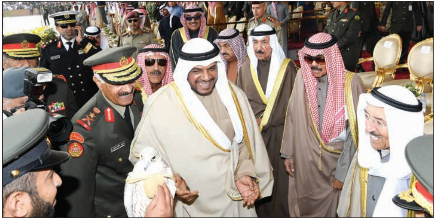
صاحب السمو الأمير الشيخ صباح الأحمد يتسلم صقرا هدية تذكارية بحضور سمو ولي العهد الشيخ نواف الأحمد والشيخ أحمد المنصور والفريق الركن محمد الخضر

خالد العتيبي: التدريب هو عصب الجيوش والعنصر الأكثر أهمية في تحديد كفاءتها القتالية وبقدر ما يكون وافياً وشاملاً واحترافياً بقدر ما يؤدي دوره في توظيف القدرات والطاقات