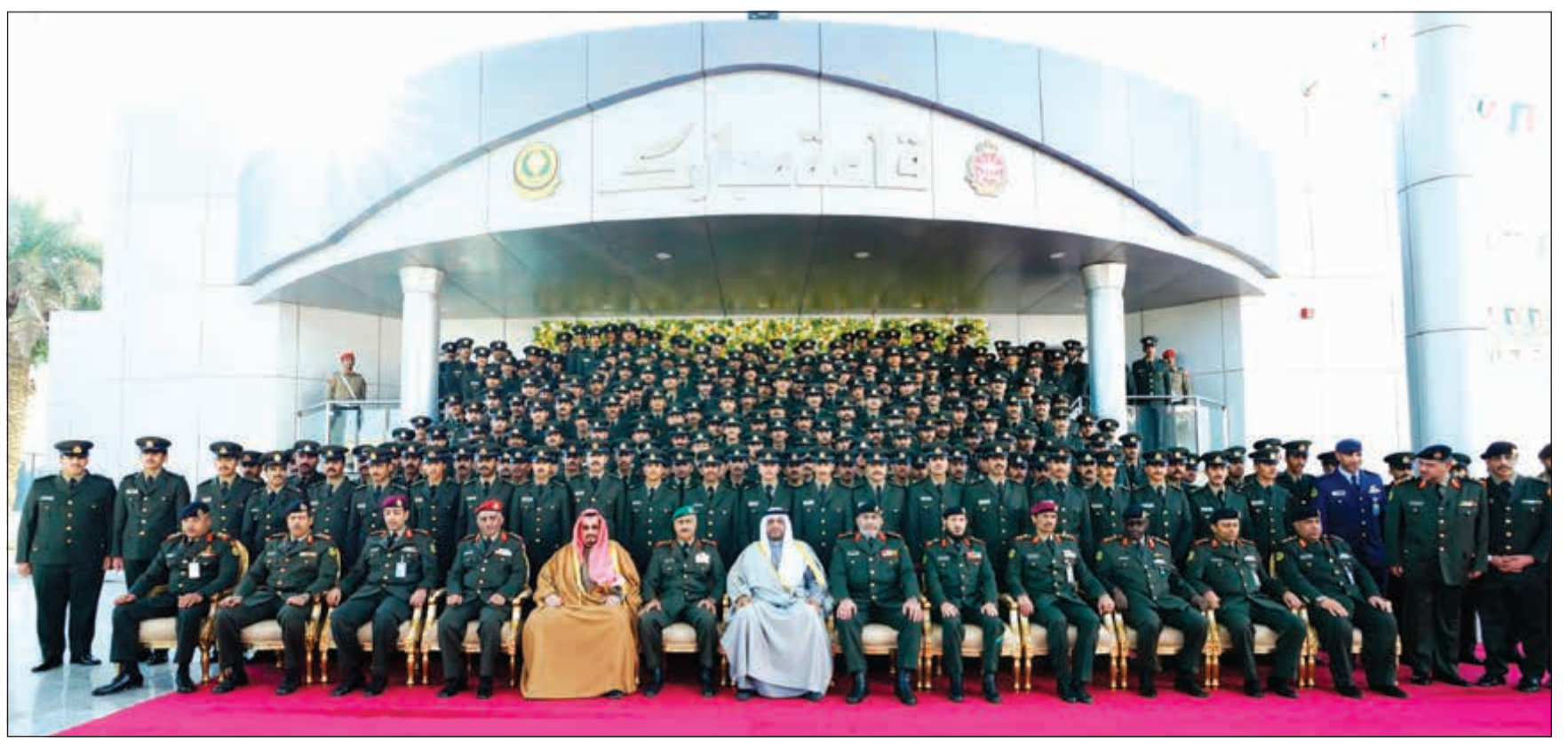
الشيخ أحمد المنصور والفريق الركن محمد الخضر والفريق الركن الشيخ خالد الصالح الصباح والشيخ فهد جابر العلي وأعضاء مجلس الدفاع العسكري وعدد من كبار القادة بالجيش

لكن وطنكم دائما في قلوبكم وفي نصب اعينكم وتمسكوا بالولاء المطلق لوطنكم لأنه سياج وضمأن وحدته وسيادته واستقلاله. وان تكونوا واعين تماما