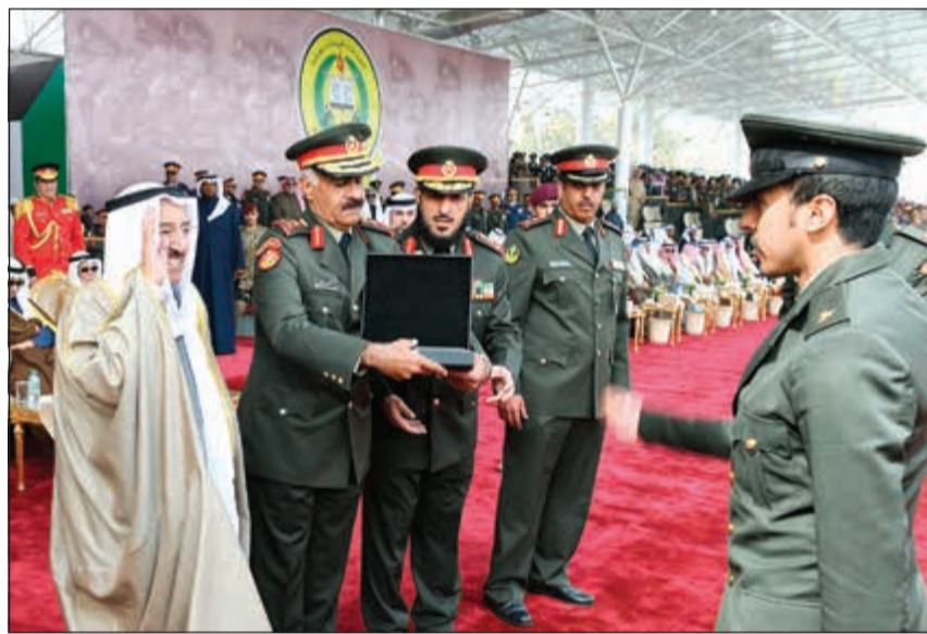
صاحب السمو يؤدي التحية العسكرية لأحد الخريجين