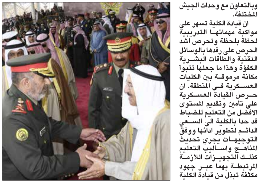
صاحب السمو مصافحا الفريق الركن الشيخ خالد الصالح الصباح

في كلية علي الصباح العسكرية من قادة وضباط ومعلمين ومدربين واداريين على اخلاصهم وتفانيهم بالعمل في اعداد وتاهيل هذه الكوكبة الجديدة من الضباط، داعيا المولى عز وجل أن يحفظ الكويت تحت ظل القيادة الحكيمة لصاحب السمو الأمير القائد الأعلى للقوات المسلحة وسمو ولي العهد وسمو رئيس مجلس الوزراء وحضر حفل توزيع الشهادات رئيس الأركان العامة للجيش الفريق الركن محمد الخضر ونائب رئيس الأركان الدفاع الفريق الركن خالد صالح الصباح ووكيل وزارة الدفاع بالتكليف الشيخ فهد جابر العلي الصباح وأعضاء مجلس الدفاع العسكري وعدد من كبار القادة بالجيش.