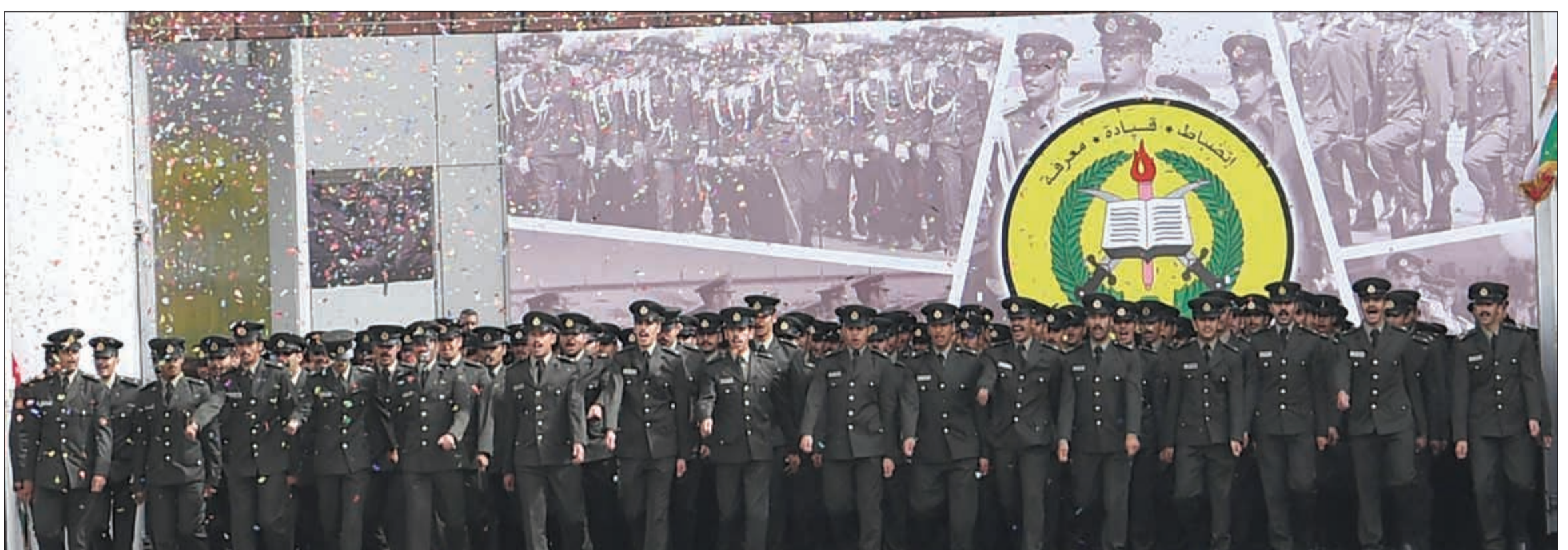
الخريجون في صورة جماعية

تحت رعاية وحضور صاحب السمو الأمير الشيخ صباح الأحمد القائد الأعلى للقوات المسلحة أقيم صباح امس حفل تخريج دفعة الطلبة الضباط (46) بكلية علي الصباح العسكرية. ووصل موكب سموه إلى مكان الحفل حيث استقبل بكل حفاوة وترحيب من نائب رئيس مجلس الوزراء وزير الدفاع الشيخ أحمد المنصور ورئيس الأركان العامة للجيش الفريق الركن محمد الخضر، ونائب رئيس الأركان الفريق الركن الشيخ خالد الصالح الصباح، وكيل وزارة الدفاع بالندب الشيخ فهد جابر العلي، ومساعد أمر كلية علي الصباح العسكرية العميد الركن خالد شجاع العتيبي وقيادات الكلية. وشهد حفل التخرج سمو ولي العهد الشيخ نواف الأحمد ورئيس مجلس الأمة مرزوق الغانم وسمو الشيخ صباح الخالد رئيس مجلس الوزراء ورئيس المجلس الأعلى للقضاء ورئيس محكمة التمييز ورئيس المحكمة الدستورية المستشار يوسف المطوعة وجمع غفير من أهالي الطلبة الخريجين والمواطنين. وبدأ الحفل بالسلام الوطني ثم تلاوة ما تيسر من آيات الذكر الحكيم بعدها كلمة أمر كلية علي الصباح العسكرية القاها مساعد أمر الكلية.. فيما يلي نصها: صاحب السمو الأمير الشيخ صباح الأحمد