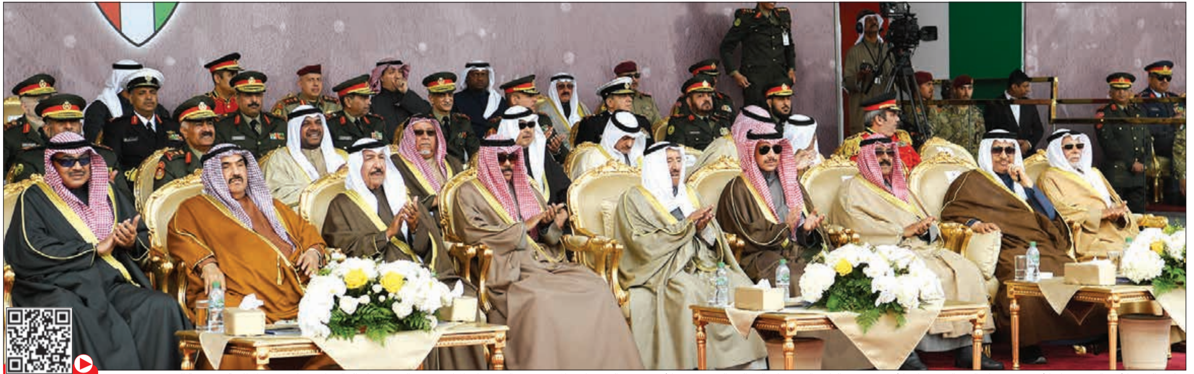
صاحب السمو الأمير الشيخ صباح الأحمد وسمو ولي العهد الشيخ نواف الأحمد ومرزوق الغانم والشيخ جابر العبدالله والشيخ مشعل الأحمد وسمو الشيخ ناصر المحمد وسمو الشيخ جابر المبارك وسمو الشيخ صباح الخالد والمستشار يوسف المطوعة في مقدمة الحضور