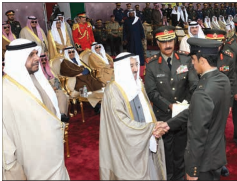
تكريم أحد الخريجين