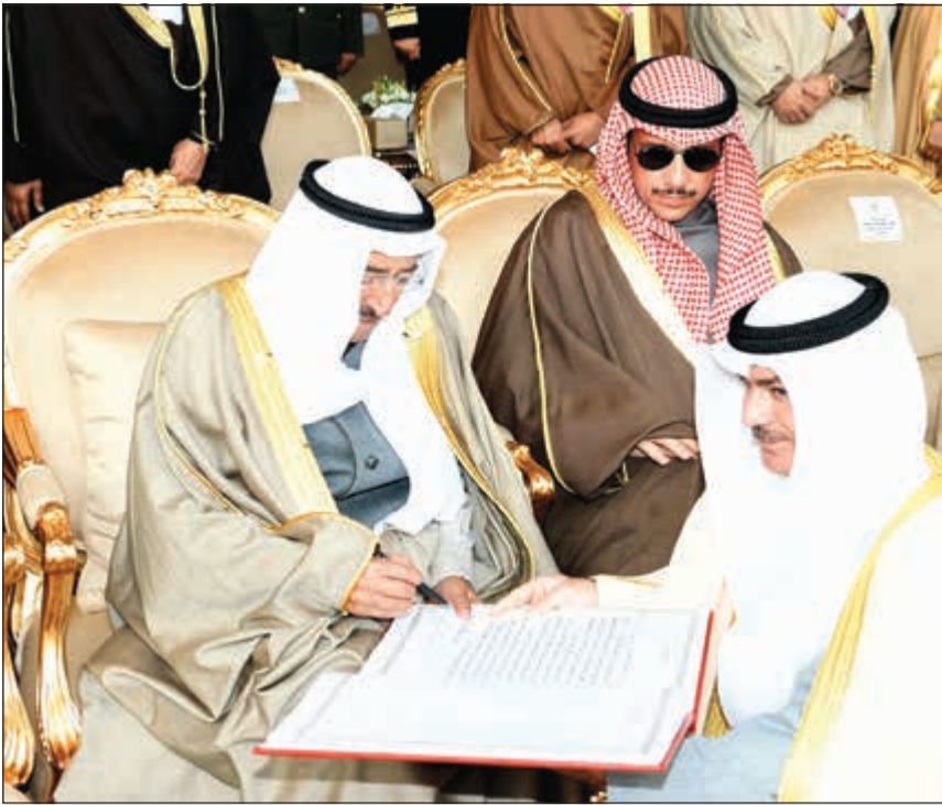
صاحب السمو الأمير يسجل كلمة في سجل الكلية بحضور رئيس مجلس الأمة مرزوق الغانم