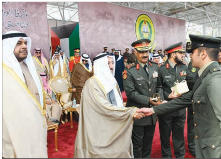
صاحب السمو مصافحا أحد الخريجين