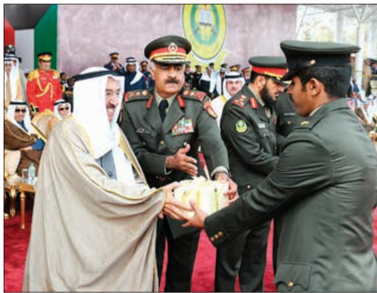
صاحب السمو مكرما أحد الخريجين