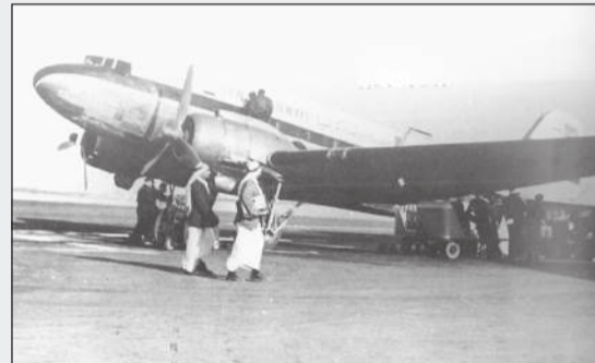
.. والطائرة الثانية من نوع داکوتا دي سي 3 «وارة»

تطورت الفكرة بعد ذلك لتعود إلى مشروع عرضه الرجلان على مجموعة من كبار رجال الأعمال الكويتيين الذين ناقشوه واقتنعوا به ثم عرضه على الحكومة طالبين تأسيس شركة طيران وطنية برأسمال قدره مليوناً روبيّة موزعة على أسهم قيمة كل سهم 100 روبية. بعد أن لاقى المشروع استحساناً وصدى كبيرين في الأوساط الكويتية، تقدمت المجموعة التأسيسية بهذه الفكرة الوليدة على حاكم الكويت آنذاك، المغفور له بإذن الله الشيخ عبدالله السالم، الذي وافق عليها فوراً وحصل المساهمون على الترخيص بذلك في مارس 1954 ليكون ذلك إيذاناً ببدء إجراءات تأسيس الناقل الوطني للكويت. هذه المعلومات التاريخية الثرية عن الناقل الوطني