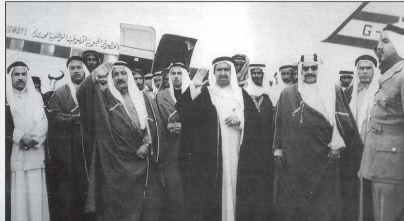
الشيخ عبدالله المبارك ومستقبله في مطار النزهة عام 1955 لدى عودته من الخارج على متن «الكويتية» باسمها القديم عند التأسيس

تدل الوثائق الأميركية على أنه تم البدء في الإعداد لإنشاء «شركة الخطوط الجوية الكويتية الوطنية المحدودة»، وإقامتها جدياً عام 1953. جاء ذلك بعد أن بدأت فكرة إنشاء