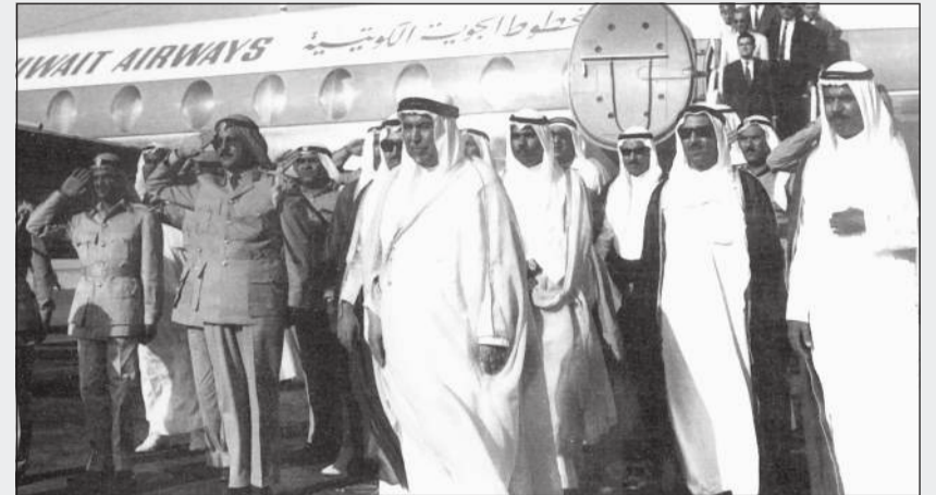
أمير الكويت الراحل الشيخ عبدالله السالم لدى وصوله إلى الكويت من الإسكندرية عام 1964 على متن «الكويتية»، وكان في استقباله سمو الأمير الراحل الشيخ جابر الأحمد وصاحب السمو الأمير الشيخ صباح الأحمد وسمو ولي العهد الشيخ نواف الأحمد

يتناول الباب الخامس «65 عاماً من الريادة» الاحتفال بالذكرى الـ65 على التأسيس وكيف طار «الطائر الأزرق» من المنفى رافعا راية العز والكويتية، قبل أن يتطرق إلى رحلة التحرير والإعمار وكيف نقلت «الكويتية» الرئيس الأميركي الأسبق جورج بوش الأب إلى الوطن المحرر، كما يتناول الفصل الخامس من هذا الباب تدير أسطول المؤسسة أثناء العدوان العراقي وحالة الأسطول قبل الغزو وتسلم حطام الطائرات من بغداد وعودة الطائرات المسروقة من إيران. «قانون التخصصة وتعديلاته»، كان هذا عنوان الباب الرابع من الكتاب الذي يتناول في فصلين صدور هذا القانون وتبعية الخطوط الجوية الكويتية وإجراءات تأسيس الشركة وإعادة الهيكلة قبل التخصص وكذلك إنهاء التبعية لهيئة الاستثمار. فيما