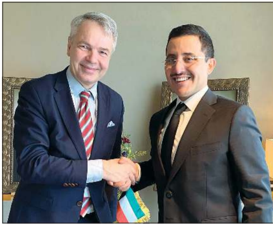
..مستقبلاً نظيره الفنلندي