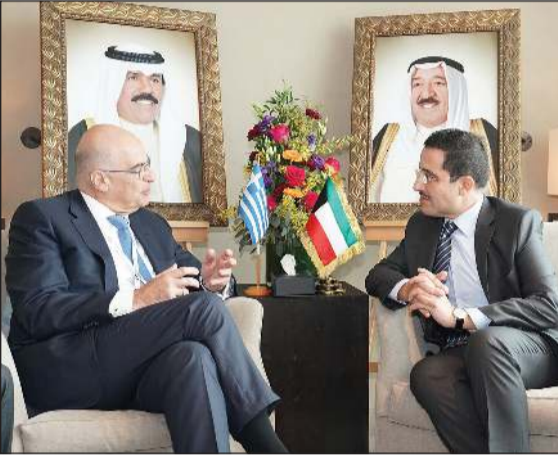
الشيخ د. أحمد ناصر المحمد ملتقياً نظيره اليوناني

حضر اللقاءات سفيرا لدى جمهورية ألمانيا الاتحادية ونائب مدير البدر ونائب مساعد وزير الخارجية لشؤون أوروبا المستشار محمد حياتي.