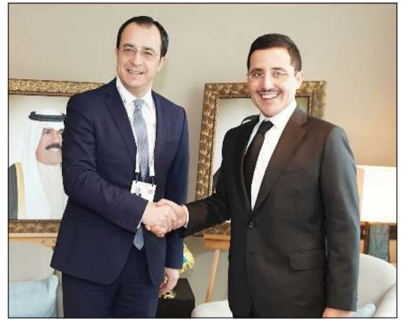
الشيخ د. أحمد ناصر المحمد مستقبلاً وزير خارجية قبرص

التقى الممثل الأعلى للشؤون الخارجية في الاتحاد الأوروبي والمبعوث الأممي لسورية على هامش أعمال الدورة السادسة والخمسين لمؤتمر ميونيخ للأمن