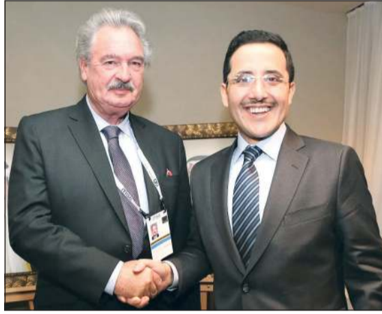
الشيخ د. أحمد ناصر المحمد ملتقياً وزير خارجية رومانيا لوكسمبورغ