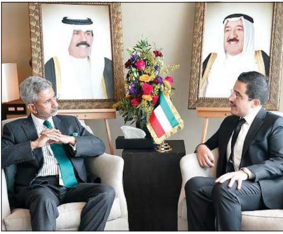
وزير الخارجية خلال لقائه مع نظيره الهندي دسوبراهمانيام جايشانكر