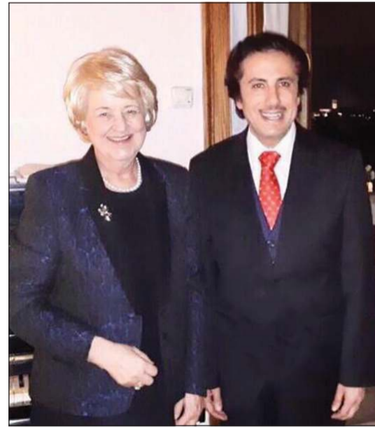
السفير الشيخ عزام الصباح خلال اللقاء مع المدير العام لمنظمة «ايدلو» جان بيغلي

وانضمت الكويت في أكتوبر 2011 لعضوية المنظمة الدولية لقانون التنمية التي تأسست في 1983 بهدف تعزيز الإصلاحات القانونية والتنظيمية والمؤسسية لمساندة ودفع عجلة التنمية الاقتصادية والاجتماعية في البلدان النامية والتي تمر بمراحل انتقال.