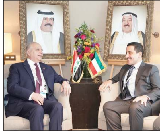
وزير الخارجية مستقبلاً نظيره العراقي

العام للأمم المتحدة لسورية السفير غير بيدرسن وذلك على هامش أعمال الدورة السادسة والخمسين لمؤتمر ميونيخ للأمن. وقد جدد وزير الخارجية دعم الكويت لمبعوث الأمين العام إلى سورية الأسن والاستقرار في ربوع سورية الشقيقة.