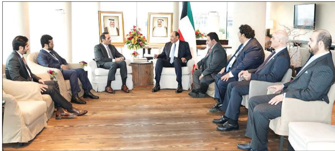
سمو رئيس الوزراء لدى لقائه وزير خارجية قطر الوفد المرافق له