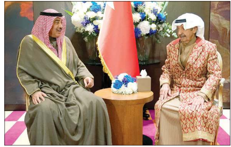
سمو رئيس الوزراء الشيخ صباح خالد خلال زيارته لقطره البحريني صاحب السمو الملكي الامير خليفة بن سلمان