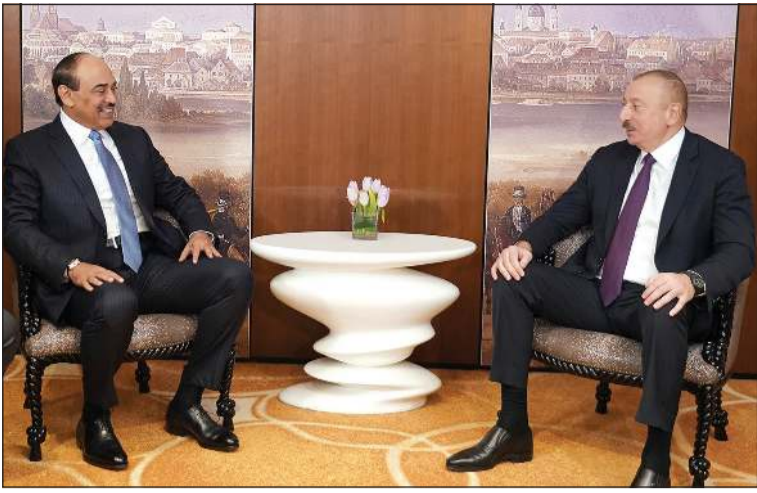
سمو الشيخ صباح خالد خلال لقائه مع رئيس أذربيجان الهام علييف