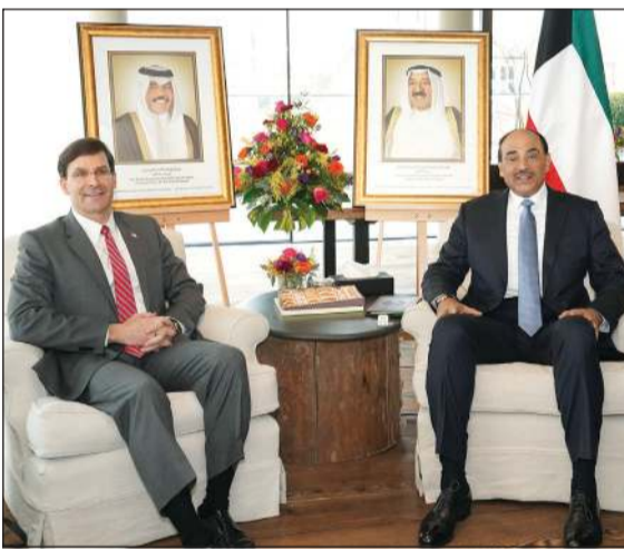
سمو الشيخ صباح خالد خلال اللقاء مع وزير الدفاع الأميركي مارك اسپير

اجتمع سمو رئيس الوزراء الشيخ صباح خالد على هامش مؤتمر ميونخ للأمن أمس رئيس جمهورية كازاخستان الصديقة كاسيم جومارت توكايف بمقر إقامته بمدينة ميونخ في ألمانيا الاتحادية. كما اجتمع سموه بمقر إقامته الي رئيس جمهورية أستونيا الصديقة كيرستي كاليويد. حضر اللقاءين وزير الخارجية الشيخ د.أحمد ناصر المحمد ورئيس جهاز الأمن الوطني الشيخ ثامر العلي وأعضاء الوفد الرسمي المرافق لسموه.