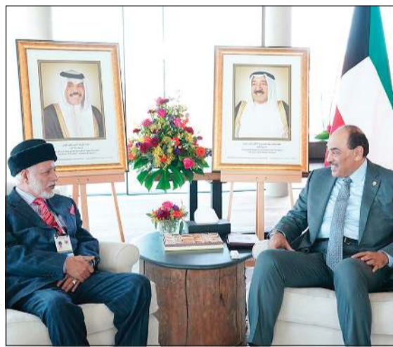
جانب من اللقاء مع وزير خارجية عمان يوسف بن علوي