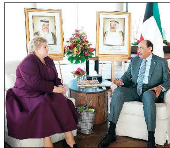
.. وسموه مستقبلاً نظيره الترويحية