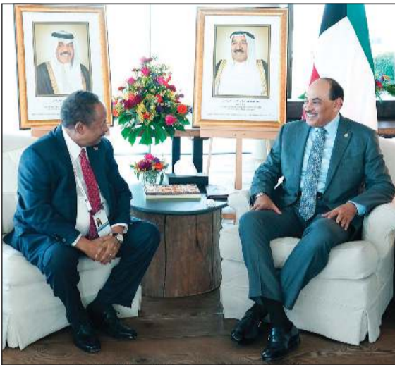
الخالد ملتقياً رئيس وزراء السودان د.عبدالله حمدوك