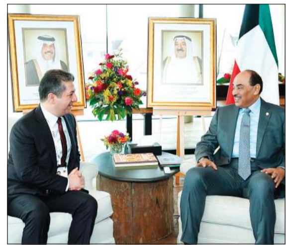
سمو رئيس الوزراء مستقبلاً رئيس وزراء إقليم كردستان