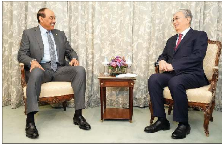
سمو رئيس الوزراء الشيخ صباح خالد مستقبلاً رئيس كازاخستان كاسيم جومارت